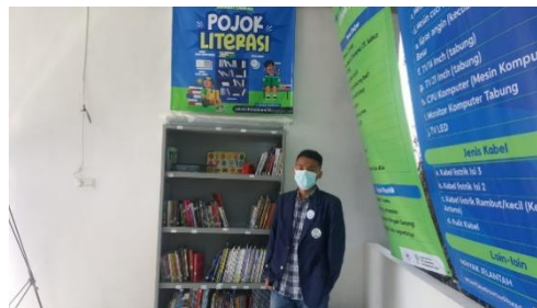
Gambar 4, Kondisi Akhir Setelah Buku Ditata Rapih Sesuai Kategori Pada Lemari Besi