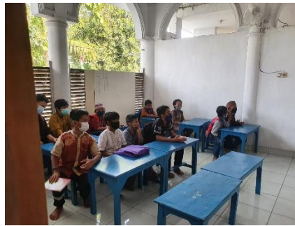
Gambar 5. Kondisi kelas saat menghafal doa-doa pilihan