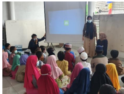
Gambar 6. Kegiatan menonton video menggunakan proyektor