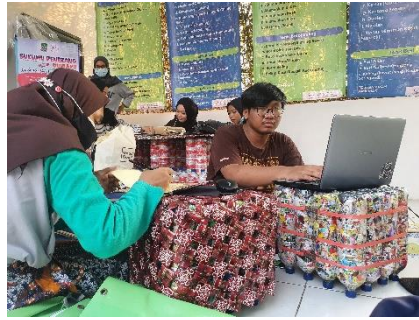
Gambar 3. Pemberian Kode Pada Setiap Buku dan Pendatan Manual ke Website