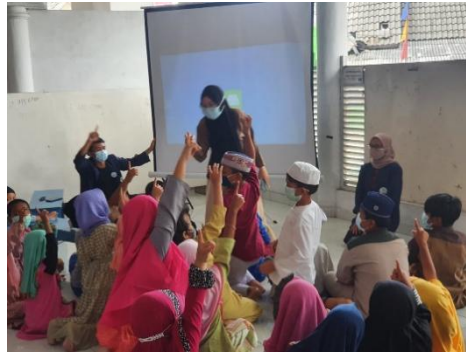
Gambar 7. Kegiatan Games