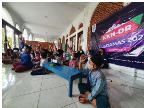
Gambar 7. Kegiatan Games