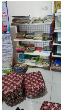
Gambar 1. Penyimpanan Buku yang Tidak Efektif