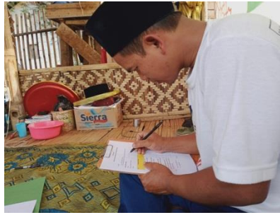
Gambar 3. Pengisian Kuisisioner

Data yang diambil menggunakan data kuantitatif dengan kuesioner yang diisi oleh petani di Desa Mekarjaya terutama yang telah mengikuti sosialisasi pupuk menggunakan limbah organik. Peserta KKN melakukan survey dengan cara menyebarkan kuesioner sebagai instrumen pengabdian, kuesioner akan menjadi wadah yang efektif dan efisien untuk mengumpulkan data yang akan diukur secara numerik.