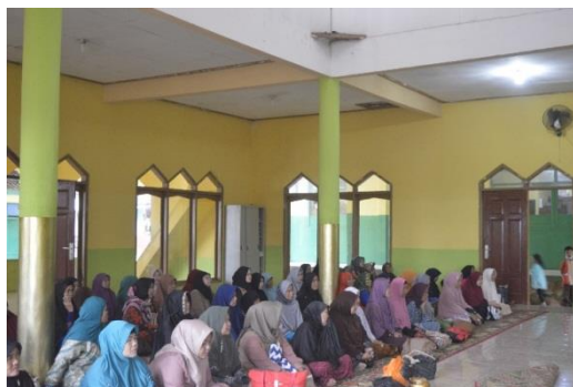
Gambar 1. Rembug warga