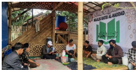
Gambar 2. Diskusi dan Sosialisasi Pupuk

Program sosialisasi pupuk menggunakan limbah organik dilaksanakan pada tanggal 22 Agustus 2021 pukul 09.00-11.00 WIB di markas kelompok tani Jouhar Jaya Desa Mekarjaya. Sosialisasi ini dihadiri oleh warga yang berprofesi di bidang pertanian dan pemuda yang memiliki minat dalam bidang pertanian. Kegiatan ini meliputi praktik pembuatan pupuk organik dan diskusi mengenai pemilihan limbah serta manfaatnya.