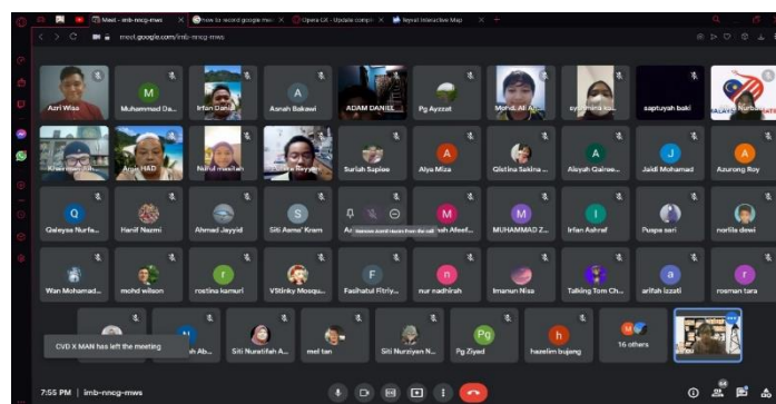
Gambar 3. Foto ketika program yang dibuat dijalankan secara talian (online)