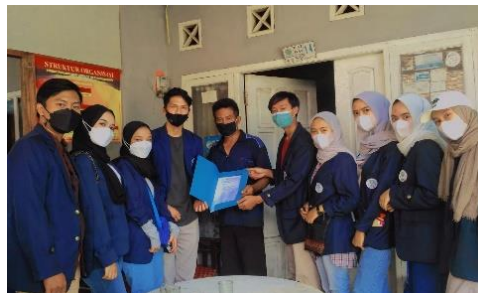
Gambar 2 Perizinan kepada ketua RW 03, Kel. Pasir Endah

Dalam tabel 1, dan gambar 2 kegiatan pertama dilaksanakan pada tanggal 4 Agustus 2021, yaitu mengunjungi rumah ketua RW 03 Kel. Pasir Endah dalam rangka permohonan izin untuk dilaksanakannya KKN-DR SISDAMAS kelompok 7 di wilayah tersebut. Ketua RW 03 menyambut dengan hangat para mahasiswa yang ingin melaksanakan kegiatan KKN-DR SISDAMAS di RW 03, Kel. Pasir Endah, Kec. Ujung Berung, kemudian beliau menerima serta memberikan izin kepada para mahasiswa yang akan melaksanakan KKN-DR SISDAMAS.