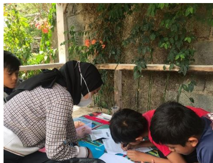
Gambar 4. Proses bimbingan atau kelompok belajars

Adapun untuk tingkatan SD, materi yang disampaikan yakni sesuai dengan tingkatan kelas masing-masing anak dan menggunakan acuan buku tematik. Selain penyampaian materi, diadakan sistem tanya jawab oleh pengajar dan para siswa dengan tujuan menjadi tolak ukur penilaian atas pemahaman para siswa terhadap materi yang diajarkan. Sebelum pulang ke rumah masing-masing, anak-anak yang aktif dalam proses pembelajaran akan mendapatkan reward berupa makanan atau cemilan sebagai bentuk penghargaan dan motivasi terhadap mereka.