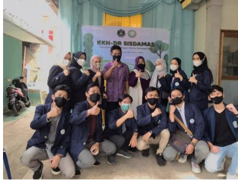
Gambar 3 Pembukaan KKN-DR SISDAMAS kelompok 7 dan refleksi sosial

Pada gambar 3, kami melaksanakan pembukaan resmi KKN-DR SISDAMAS Kelompok 7 yaitu pada tanggal 5 Agustus 2021, sekaligus melakukan sosialisasi bersama warga, ketua RT dan RW setempat sebagai upaya pengenalan KKN-DR SISDAMAS serta melakukan identifikasi permasalahan yang ada di RW 03 Kel. Pasir Endah, khususnya pada bagian pendidikan. Selama era pandemi, proses belajar mengajar di sekolah dilakukan secara daring guna memutuskan mata rantai penyebaran covid-19. Akan tetapi sangat disayangkan di era pandemi seperti saat ini masih banyak masyarakat yang merasa kesulitan dalam pembelajaran daring. Hal yang menjadi pemicu utama ialah kurangnya fasilitas. Misalnya masih banyak warga yang tidak memiliki smartphone, terkendala biaya untuk membeli kuota internet, atau sinyal provider yang kurang memadai di wilayah tersebut dan lain sebagainya.