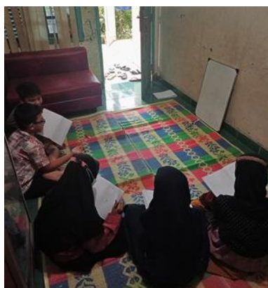
Gambar 1. Suasana pembelajaran

Kedua, tahap pelaksanaan. Tahap pelaksanaan merupakan kegiatan inti dari kegiatan pengabdian ini. Pada tahapan ini penulis melakukan pengajaran kepada peserta yang datang. Metode pengajarannya meliputi ceramah, kuis, latihan soal, dan interaksi. Tahap pelaksanaan pada awalnya dilakukan setiap hari senin sampai Kamis selama tiga minggu. Dengan rincian 9-12 Agustus, 16-19 Agustus, 23-26 Agustus. Namun, karena minggu kedua bertepatan dengan Tujuh Belasan maka hari tersebut kegiatan pengajaran diliburkan dan penulis membiarkan anak-anak mengikuti lomba yang diadakan di lingkungan sekitar. Maka, untuk mengganti tanggal 17 penulis memberikan jadwal tambahan pada minggu ketiga, sehingga pada minggu ketiga kegiatan dilakukan selama lima hari. Jadi, yang semula kegiatan pengabdian selesai pada tanggal 26 harus dimundurkan sehari menjadi tanggal 27 Agustus.