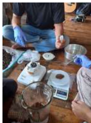
Gambar 6. Pembuatan teh Cascara

Kegiatan yang dilakukan merupakan salah satu dari program kami yang terkhusus pada masyarakat petani kopi yang memang sebelumnya telah ada. Kami menyelenggarakan kegiatan pengembangan produk Cascara (kulit kopi) menjadi sebuah teh sebagai solusi alternatif permasalahan ekonomi masyarakat. Teh yang dibuatkan melalui beberapa tahapan seperti kulit kopi atau limbah kopi yang kemudian di keringkan dalam beberapa hari hingga kering, setelah itu dilakukan pemilahan kulit kopi yang ditujukan agar menghasilkan teh yang berkualitas, kemudian kulit kopi tersebut dipanggang menggunakan oven selama kurang lebih 5 menit, setelah itu dilakukan penghalusan kulit kopi menggunakan blender (3/4 halus). Setelah itu ditimbang sesuai berat (gram) yang telah disesuaikan sesuai takaran. Kemudian dilakukan pengemasan.