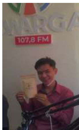
Gambar 12. Pemasaran melalui siaran radio