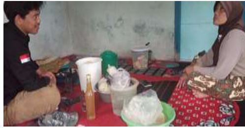
Gambar 10. Sosialisasi brand produk madu