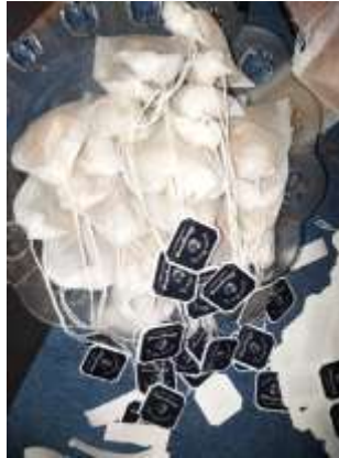
Gambar 7. Hasil dari pembuatan teh Cascara