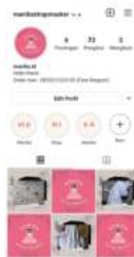
Gambar 11. Tampilan instagram setelah mengikuti pendampingan pemasaran digital

Pada kegiatan ini pengabdian memberikan pendampingan pemasaran digital kepada masyarakat dengan cara memberikan pembaruan pada tampilan instagram dengan meng-upload foto produk hasil dari pelatihan pembuatan strap masker dan produk teh Cascara dengan sosialisasi digital melalui siaran radio.