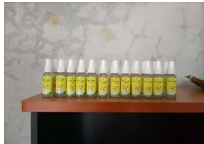
Gambar 5. Hasil pelatihan membuat hand sanitizer