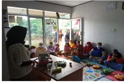
Gambar 4. Pelatihan pembuatan hand sanitizer