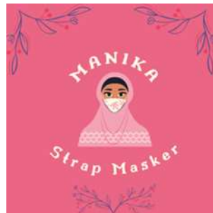
Gambar 8. Pembuatan brand produk strap masker

Kegiatan ini dilakukan kepada seluruh anggota yang mengikuti sosialisasi dan pelatihan UMKM. Pengabdian memberikan arahan mengenai cara membuat suatu brand (merek), cara membuat logo suatu produk, memberi arahan cara memfoto atau membuat video produk, cara mengupload produk ke akun sosial media agar lebih menarik dan juga memberi arahan bagaimana cara pengemasan yang baik.