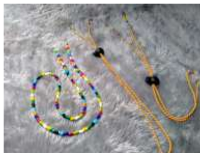
Gambar 3. Hasil dari pelatihan membuat strap masker