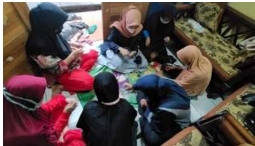
Gambar 2. Kegiatan pelatihan membuat strap masker

Kegiatan ini dilakukan kepada seluruh anggota yang mengikuti pelatihan UMKM, dimana setiap anggotanya diajarkan cara membuat strap masker dengan dua model. Yang pertama strap masker dengan menggunakan manik-manik dan kedua strap masker yang menggunakan tali dengan model serut. Masyarakat cukup antusias dan bersemangat saat melakukan pelatihan.