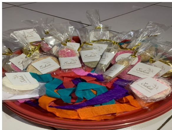
Gambar 4. Pengemasan dan Digital Branding Sabun 'Sahati'

Dalam Praktek ini selain bahan dasar limbah minyak jelantah di butuhkan juga bahan bahan tambahan diantaranya adalah garam, areng, dan soda api, serta tambahan nya bisa daun jeruk nipis sebagai pewanginya. Dalam praktik ini banyak yang harus di perhatikan dari mulai pemahaman takaran adonanya, da nada salah satu bahan yang cukup berbahaya yaitu soda api, apabila kena kulit tangan manusia akan menimbulkan efek gatal.