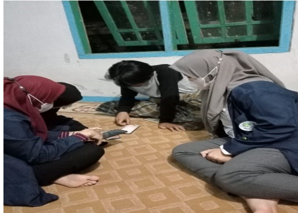
Gambar 8. Pelatihan Digital Branding Iklan Online dan Pembuatan Voucher Diskon