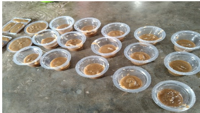
Gambar 3. Praktek pembuatan sabun dari minyak jelantah

Demonstrasi dan Praktek pengelolaan limbah minyak jelantah dan digital branding pada produk sabun ramah lingkungan. Setelah di berikan pemahaman tentang pengelolaan limbah minyak jelantah menjadi produk sabun ramah lingkungan serta digital branding yang menjadi ide usaha baru bagi masyarakat, langkah selanjutnya adalah tahap praktek.