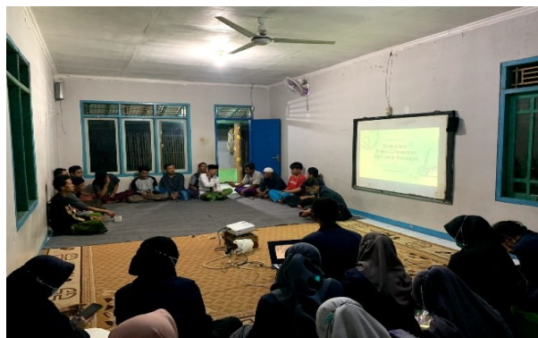
Gambar 2. Sosialisasi dan pemahaman karang taruna tentang Konsep 3R dan Digital Branding.

Kegiatan yang kedua adalah memberikan sosialisasi dan pemahaman masyarakat tentang pengelolaan limbah minyak jelantah dengan menggunakan konsep Circular Economy 3 R ( Reduce – Reused – Recycle ) sesuai konsep ini mengubah limbah atau sampah menjadi barang yang bermanfaat , dari bahan dasar minyak jelantah bisa dijadikan sabun ramah lingkungan , bisa di gunakan untuk mencuci tangan dan mencuci piring. Tidak hanya ramah lingkungan sabun ini juga bisa menjadi barang yang bernilai ekonomis, dan bisa menjadi salah satu ide usaha bagi masyarakat.