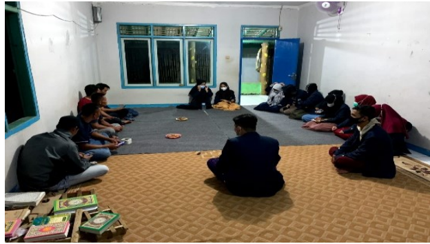
Gambar 1. Diskusi dan Fiksasi Program Kerja

Selain diskusi tentang keadaan masyarakat kampung cikereti, kami juga berdiskusi tentang keadaan karang taruna unit disana. Kondisi karang taruna unit di kampung cikereti Rt 002 belum memiliki Surat Keterangan (SK) kepengurusan yang sah dari pihak Desa Sukamaju, oleh karena itu, pendanaan karang taruna tidak ada anggaran dari pemerintah desa, sampai saat ini pendanaan hanya bersumber dari masyarakat Door to Door atau penggalangan dana oleh karang taruna setiap akan mengadakan acara di kampung Cikereti.