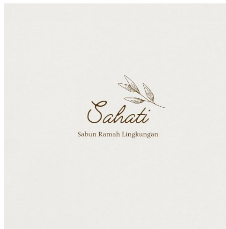
Gambar 5. Logo produk sabun 'Sahati'

Pada produk sabun ini kami memutuskan untuk memberi nama logo atau merek sabun 'SAHATI' yang memiliki arti sabun ramah lingkungan produk cikereti. Cikereti adalah nama kampung karang taruna itu berdiri.