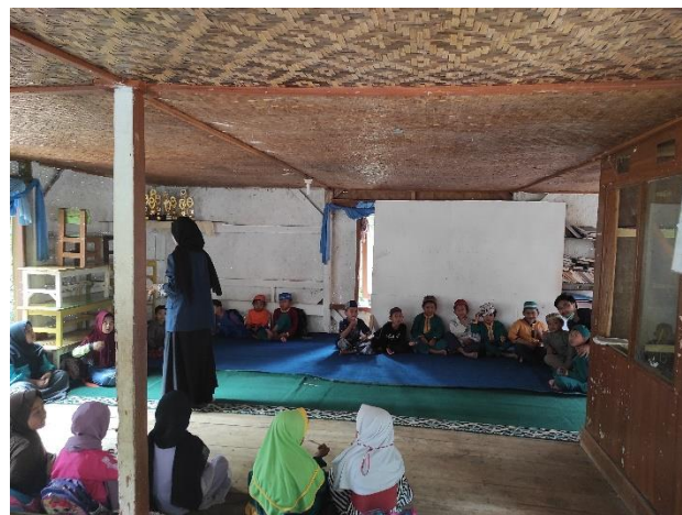
Gambar 3. Mengajar rutin MDT Khalasha

Selain mengajar, ada pula senam rutin setiap hari Kamis bersama dengan RA Khalasha. Senam rutin yang diikuti oleh peserta KKN dilakukan selama satu bulan penuh. Senam rutin setiap hari Kamis memang rutin dilakukan sebelumnya sebagai program berolahraga sebagai bentuk olahraga bersama di pagi hari.