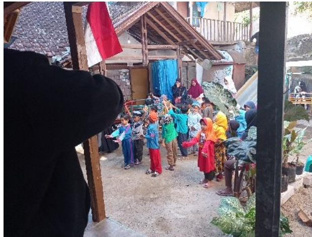
Gambar 2. senam rutin RA Khalasha

dari 13 orang dibagi menjadi beberapa orang hingga bisa bergantian untuk mengajar di RA Khalasha. Selain dari peserta KKN, mengajar rutin di RA Khalasha juga didampingi oleh 2 guru utama RA Khalasha. Pengajaran di sana juga menomor satu-kan pendidikan keagamaan yaitu selalu mengaji iqra dan setiap hari Rabu dan Jum'at dilakukan praktik solat wajib.