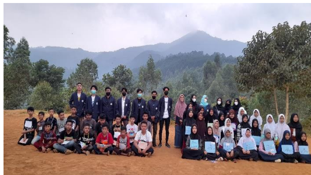
Gambar 5. Foto bersama santri

Di latar belakang permasalahan yang di dapat pada saat melakukan tahap refleksi sosial dengan, maka program pemberian motivasi belajar kepada santriwan dan santriwati di pondok pesantren Pondok Quran dilakukan. Materi yang disampaikan yaitu materi mengenai motivasi diri, motivasi belajar, dan memperkenalkan UIN kepada para santriwan dan satriwati di sana.