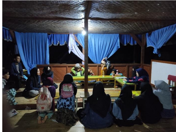
Gambar 4. Mengajar rutin MDT Khalasha

yang sangat diutamakan di MDT, namun pendidikan karakter juga tidak kalah pentingnya.