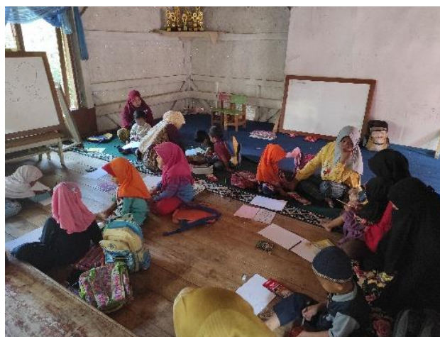
Gambar 1. Mengajar RA Khalasha

Mengajar rutin RA Khalasha dilakukan rutin dari hari Senin hingga hari Jum'at dengan tenaga pengajar dari peserta KKN yang berbeda-beda. Pengajar yang terdiri