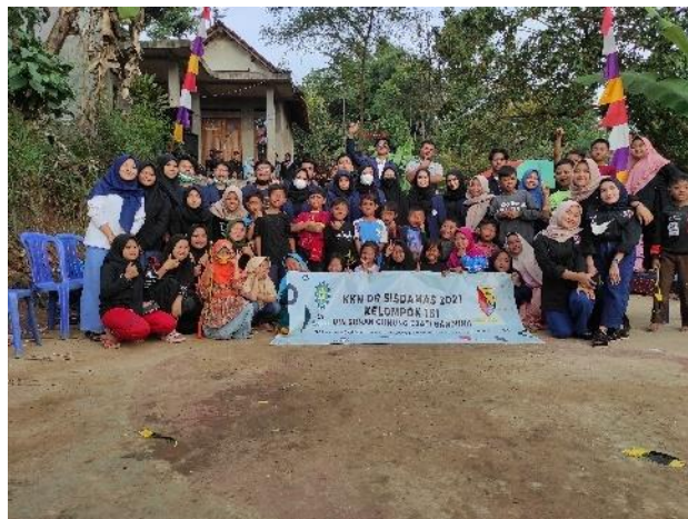
Gambar 9. Foto bersama masyarakat

Lomba mengambil koin sendiri diadakan dengan maksud agar mereka bisa bersaing secara sehat dan mengajarkan kepada mereka bahwa untuk mencapai sesuatu yang mereka inginkan maka mereka harus bekerja keras.