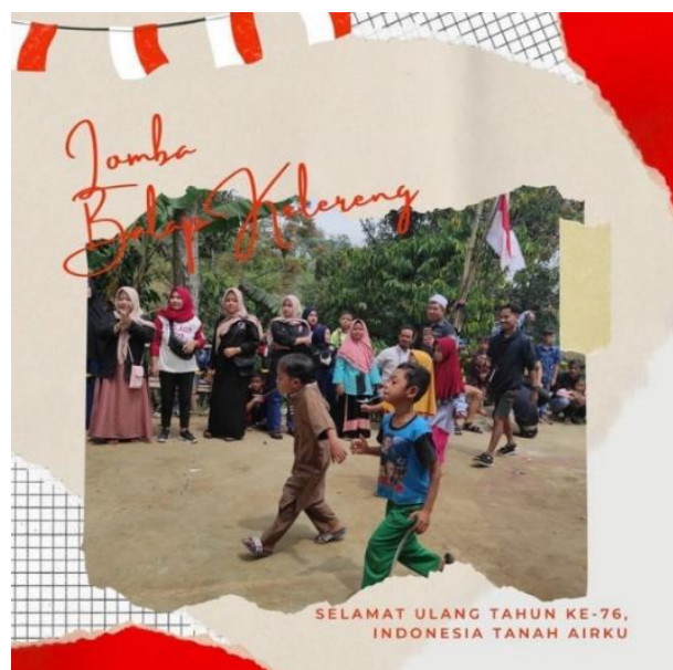
Gambar 7. Lomba balap kelereng

Lomba makan kerupuk dilakukan untuk mengajarkan anak bersaing dan memotivasi dirinya sendiri untuk mengejar apa yang mereka mau.