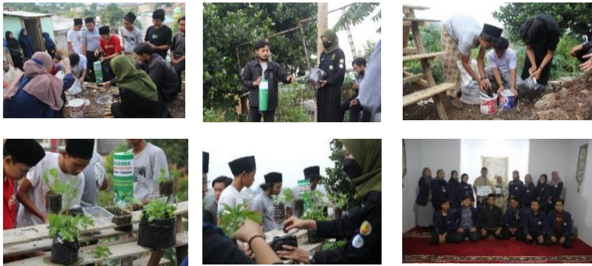
Gambar 3. Praktek, Sosialisasi, Edukasi Gerakan KangPisman di pondok pesantren Miftahul Mukhlisiin.

Hasil pemanfaatan dari sampah organik menjadi nilai tambah bagi para santri yang telah mengelola sampah di pesantrennya. Keuntungan ini tentunya akan memberikan nilai ekonomi apabila hasil dari pemanfaatannya dapat di manajemen dengan baik. Hasil evaluasi terhadap kegiatan edukasi Kangpisman menunjukkan bahwa hampir semua santri telah melakukan edukasi dengan baik bahkan telah menguasainya sebagai praktik yang dilakukan sehari-hari.