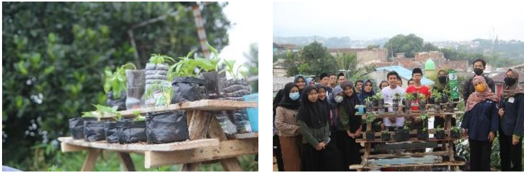
Gambar 1. Lahan Sosialisasi dan Edukasi

Sosialisasi tentang gerakan Kangpisman disampaikan dengan metode penyuluhan yang meliputi materi tentang permasalahan sampah di Kota Bandung; solusi penanganan sampah, pelaksanaan program Kangpisman, alur pengolahan sampah organik dan anorganik, pembagian kerja dalam pengelolaan sampah, jadwal kerja dalam pengelolaan sampah, pihak yang terlibat dalam pengelolaan sampah, manfaat yang diperoleh dari pengelolaan sampah. Selanjutnya kegiatan edukasi dilakukan dalam bentuk praktik yang meliputi praktik tentang pemilahan sampah anorganik, pembuatan, pengolahan sampah organik, praktek urban farming.