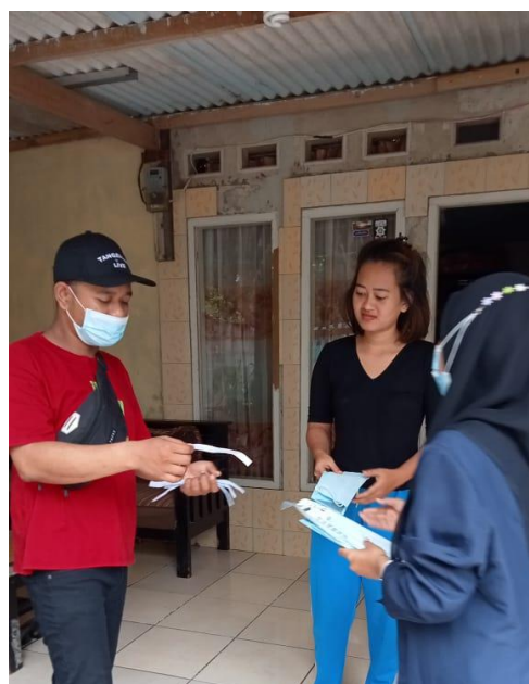
Gambar 3. Mahasiswa yang sedang melakukan sosialisasi tentang Perilaku Hidup Bersih dan Sehat bersama ketua RT

Bisa dilihat dari data di atas, terdapat pendapat yang berbeda dari kedua lingkungan RT. Di lingkungan RT 002 hanya 50% warga yang merasa pernah mendapat sosialisasi tentang protocol kesehatan, hal ini juga berpengaruh terhadap tingkat kepuasan warga terhadap ketua RT yang menjabat. Dibandingkan dengan lingkungan RT 003 yang 90,9 % warganya merasa sudah mendapat sosialisasi tentang protocol kesehatan. Menghadapi masalah ini kami berinisiatif untuk melakukan sosialisasi tentang PHBS dengan metode door to door sekaligus membagikan masker. Hal ini dilakukan agar menimbulkan kesadaran untuk selalu memakai masker dan selalu mempraktekan PHBS dimulai dari ranah yang paling dekat yaitu keluarga masing-masing.