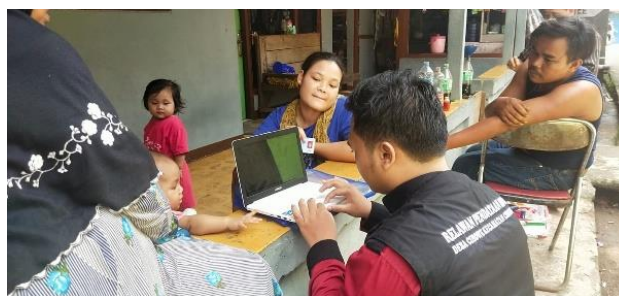
Gambar 1. Mahasiswa yang sedang melakukan survey dengan masyarakat.

Sebelum menentukan program yang akan dibuat, kami melakukan musyawarah bersama ketua RT dan Ketua RW untuk menentukan program apa yang akan dibuat. Hasil dari musyawarah ditetapkan untuk melakukan melakukan riset tentang kepuasan pelayan aparatur pemerintahan setempat dengan metode door to door , hal ini dilakukan untuk mengumpulkan data tentang kepuasan masyarakat terhadap kinerja aparatur pemerintahan setempat dan menjadi landasan pembentukan program yang akan kami buat. Setelah melakukan survey terhadap masyarakat maka lahirlah beberapa rencana program kerja. Rencana program kerja tersebut meliputi bidang kesadaran menjaga kebersihan dan kesehatan masyarakat kp. Gunung kapur.