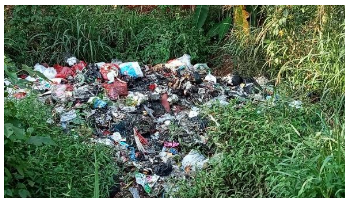
Gambar 2. Tumpukan sampah yang dibuang di kebun

Bedasarkan data yang diatas 65% warga Kp.Gunung Kapur masih membuang sampah di kebun, sungai, atau drainase dan 35% lainnya di bakar di pekarangannya sendiri. Sehingga sering terjadi penumpukan sampah di beberapa titik. Hal ini dapat berakibat pada lingkungan dan kesehatan warga. Menyadari masalah ini kami berdiskusi dengan ketua RT setempat untuk menyarankan sistem pembuangan sampah sementara yang terpusat. Program ini dimulai dengan pembuatan organigram yang mengurus sistem pembuangan sampah, yang di isi oleh ketua RT dan warga setempat. Selanjutnya pengajuan izin untuk pemakaian lahan ke kepala desa Cihowe, dan terakhir pengumpulan dan pengajuan permohonan dana untuk pembangunan tempat pembuangan sampah sementara. Dalam pelaksanaan program ini masih belum terlaksana sepenuhnya, karena kurangnya alat operasional kebersihan dan perizinan yang masih terhambat setidaknya sampai dibuatnya laporan ini. Sebagai mahasiswa yang mengabdikan di kampung Gunung Kapur kami berharap agar nantinya sistem pembuangan sampah ini bisa berjalan dengan baik dan bermanfaat bagi warga.