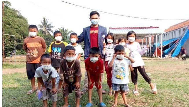
Gambar 4. Foto Bersama anak-anak yang mengikuti pembuatan video tentang protokol kesehatan

Sedangkan Untuk anak-anak kami melakukan kegiatan bersama siswa di SD Muhammadiyah 58 Parung, dengan pendekatan yang Sedikit berbeda. Kami mengajak mereka untuk membuat video yang nantinya akan diunggah di kanal youtube milik mahasiswa, hal ini bertujuan agar anak-anak lebih tertarik untuk belajar tentang protokol kesehatan dan mampu mempraktekan itu di kehidupan sehari-hari.