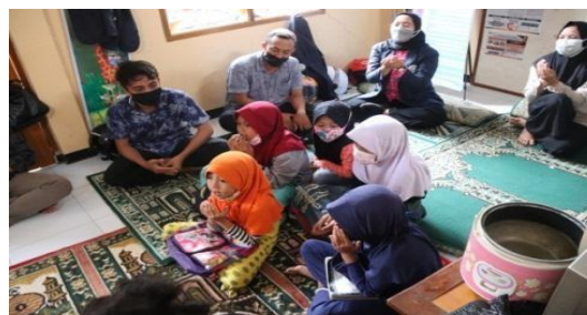
Gambar 3. Kegiatan Hafalan doa-doa harian dan surat-surat pendek

Setelah selesai, untuk menguji sejauh mana pemahaman siswa terhadap materi yang telah dipelajari, siswa melakukan permainan dengan media monolog yang telah dibuat oleh kami. Monolog tersebut berisi soal-soal materi keagamaan dan pengetasan bacaan iqro dan Al-Quran, menulis iqro dan Al-Quran, serta pengetasan hafalan doa-doa harian dan surat-surat pendek.