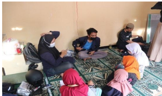
Gambar 2. Pemberantasan Buta Huruf hijaiyah

Program kerja pemberantasan buta huruf hijaiyah dilaksanakan 18 Agustus 2021 – 26 Agustus 2021. Kegiatan tersebut dimulai pada pukul 16.00 WIB – 17.00 WIB. Program ini diperuntukkan untuk anak-anak kampung Neglasari RW 20 yang berada pada jenjang TK dan SD. Kegiatan pembelajaran dimulai dengan mengenal huruf-huruf hijaiyah, kegiatan BTQ (Baca Tulis Qur'an), dan dilanjutkan dengan hafalan doa-doa dan surat-surat pendek.