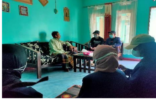
Gambar 1. Sosialisasi program Pemberantasan Buta Huruf Hijaiyah bersama dengan ketua RW Kampung Neglasari RW 20 Desa Cileunyi Kulon

Program kerja pemberantasan buta huruf hijaiyah dilaksanakan 18 Agustus 2021 – 26 Agustus 2021. Kegiatan tersebut dimulai pada pukul 16.00 WIB – 17.00 WIB. Program ini diperuntukkan untuk anak-anak kampung Neglasari RW 20 yang berada pada jenjang TK dan SD. Kegiatan pembelajaran dimulai dengan mengenal huruf-huruf hijaiyah, kegiatan BTQ (Baca Tulis Qur'an), dan dilanjutkan dengan hafalan doa-doa dan surat-surat pendek.