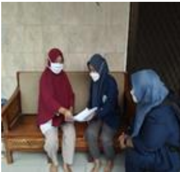
Gambar 1. Perizinan pelaksanaan KKN