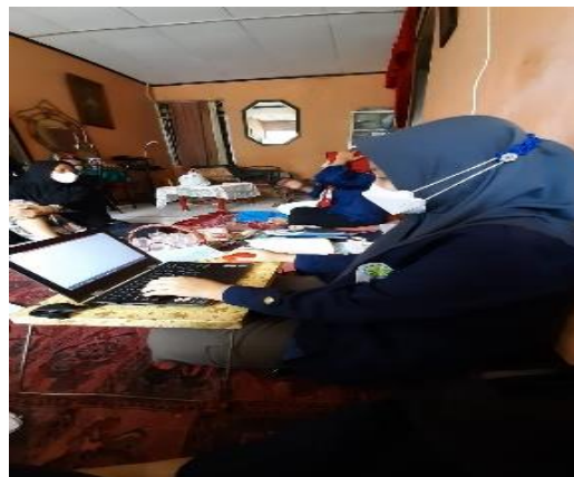
Gambar 5. Pembuatan Laporan Posyandu

Kemudian pada tanggal 20 Agustus 2021, mahasiswa melakukan pembuatan laporan dari hasil pendataan kegiatan. Laporan terdiri dari laporan F1 gizi, laporan SDIDTK, dan laporan hasil kegiatan. Pembuatan laporan dilakukan di rumah ibu ketua POSYANDU dan dihadiri para kader POSYANDU. Kemudian pada tanggal 23 Agustus 2021, laporan telah di finalisasi oleh mahasiswa dan laporan akan diserahkan kepada ibu ketua POSYANDU pada keesokan harinya yaitu pada tanggal 24 Agustus 2021.