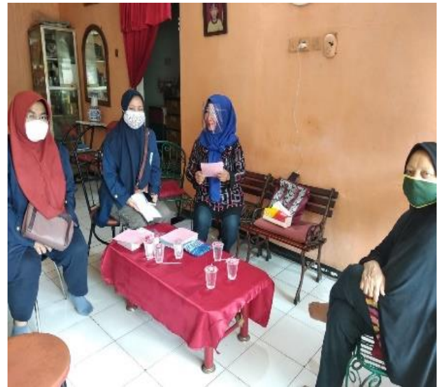
Gambar 2. Perizinan pelaksanaan KKN bersama ibu RW dan Ketua Posyandu