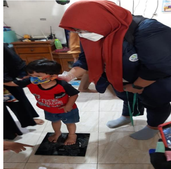
Gambar 4. Penimbangan Berat badan

Kemudian pada tanggal 20 Agustus 2021, mahasiswa melakukan pembuatan laporan dari hasil pendataan kegiatan. Laporan terdiri dari laporan F1 gizi, laporan SDIDTK, dan laporan hasil kegiatan. Pembuatan laporan dilakukan di rumah ibu ketua POSYANDU dan dihadiri para kader POSYANDU. Kemudian pada tanggal 23 Agustus 2021, laporan telah di finalisasi oleh mahasiswa dan laporan akan diserahkan kepada ibu ketua POSYANDU pada keesokan harinya yaitu pada tanggal 24 Agustus 2021.