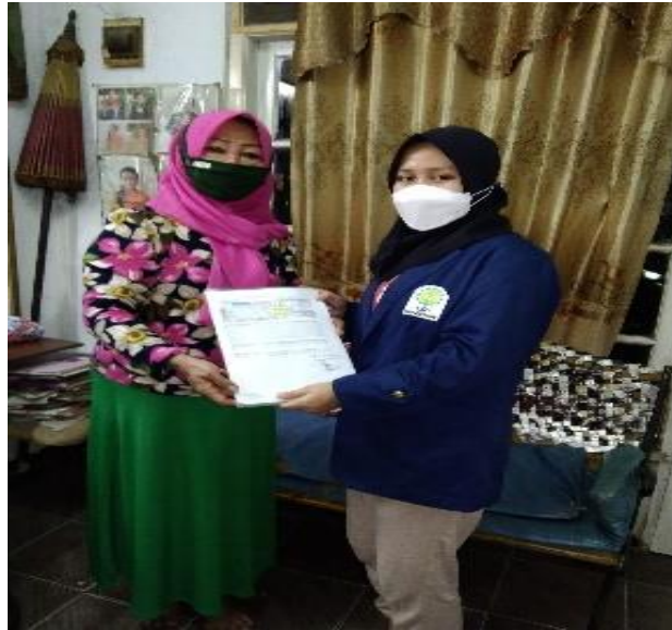
Gambar 6. Penyerahan Laporan