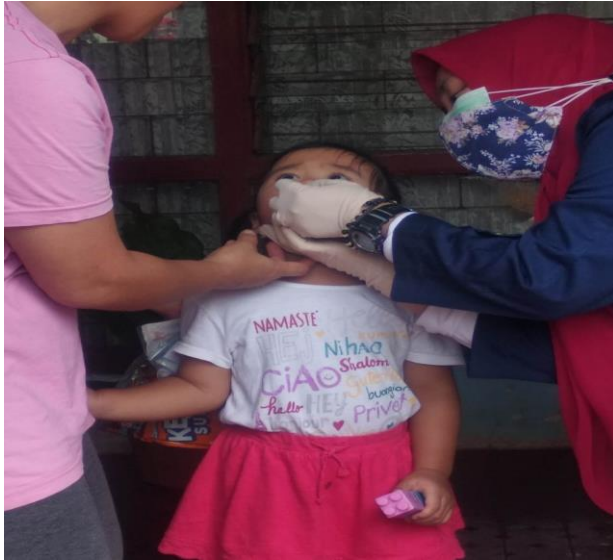
Gambar 3. Pemberian Vitamin A

Pada Tanggal 17 Agustus 2021 dilakukan sweeping door to door mengitari Komplek PAM RW 010 dengan menggunakan prosedur protokol kesehatan untuk penimbangan berat badan, pengukuran tinggi badan dan lingkar kepala serta pemberian vitamin A dan snack yang didampingi oleh Ibu RW, Ketua dan para kader POSYANDU.