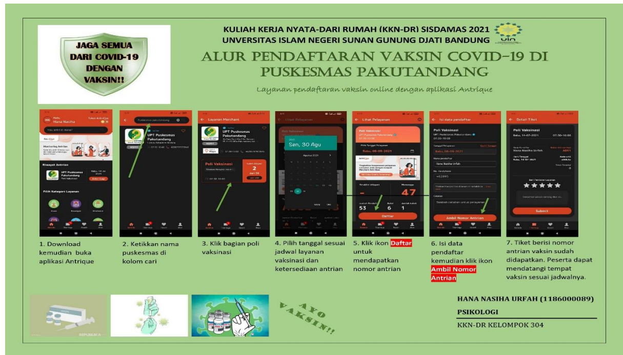
Gambar 1. Pamflet Sosialisasi Tata Cara Pendaftaran Vaksinasi Covid-19 secara Online Menggunakan Aplikasi Antrique.