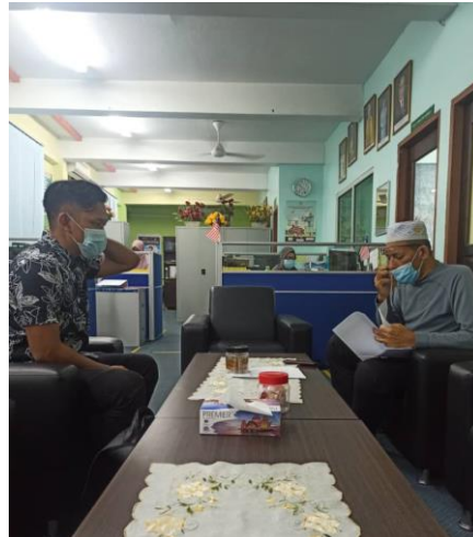
Gambar 1. Wawancara