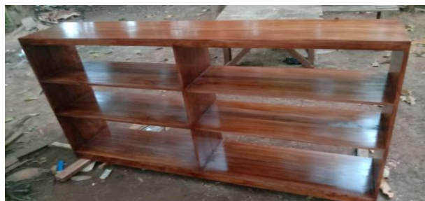
Gambar 5. Rak buku untuk pojok baca

Pelaksanaan program Pojok Baca As-Shodiqin diawali dengan survey tempat yang bertempat di Musholla As-Shodiqin. Disana kami melakukan penataan tempat dan perancangan bentuk lemari pojok baca. Perancangan tersebut meliputi tinggi, lebar, luas lemari. Akhirnya, disepakati akan berbentuk seperti lemari buku biasa dengan tiga tingkat dan dibagi dua sekat. Lemari tersebut memiliki tinggi 1 meter, dengan luas 40 centimeter, dan lebar 2 meter. Posisi lemari tersebut akan berada bertepatan di sisi kiri koridor Mushola As-Shodiqin.