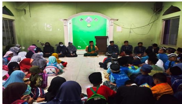
Gambar 7. Penyerahan Pojok Baca

Setelah buku tersebut, seluruh anggota memeriksa masing-masing buku tersebut terkait dengan kelayakan buku tersebut. Buku yang ada coretan didalamnya seperti buku palet pelajaran, kami hapus coretannya. Dan buku yang sudah robek kami sisihkan dan kami anggap tidak layak baca. Total ada 10 buku yang tidak layak baca untuk Pojok Baca As-Shodiqin. Lalu buku-buku tersebut kami pindahkan ke Mushola As-Shodiqin dan kami beri cap sebagai tanda kepemilikan Pojok Baca As-Shodiqin.