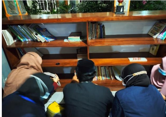
Gambar 3. Pengisian buku pada rak

program pojok baca ini. Perencanaan ini dilaksanakan melalui rapat internal anggota kelompok 72 KKN-DR UIN SGD Bandung. Diskusi mengenai pojok bac aini terbilang cepat dan lancar, karena para anggota kelompok 72 memiliki satu tujuan yang sama yaitu mengembangkan Pendidikan yang ada di dusun Daringo dengan mendirikan pojok baca sesuai yang disarankan oleh salah satu tokoh masyarakat di sana (Pak Hendri).