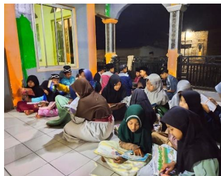
Gambar 8. Penyerahan Pojok Baca