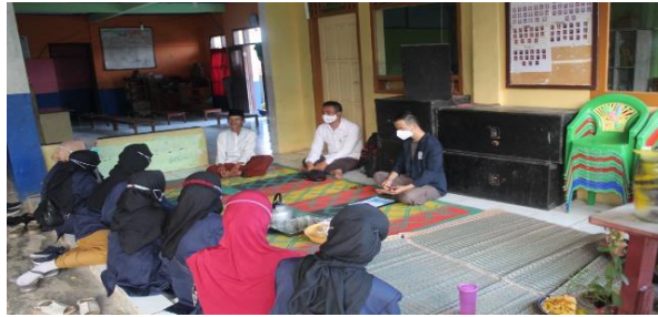
Gambar 1. Sosialisasi Bersama Warga.

Adapun, tahapan pelaksanaan kegiatan sosialisasi ini dilakukan dengan cara: (a) Kami melakukan pengambilan sampel melalui pengisian kuisioner kepada warga RW 04 di desa Cikadu sejumlah 15 orang untuk diwawancarai, (b) Setelah kegiatan pengambilan sampel selesai dilakukan, kami melakukan kegiatan sosialisasi secara langsung ( door to door ) disertai dengan pembagian undangan vaksin kepada warga desa Cikadu. Dalam hal ini, kami melakukan sosialisasi dengan mengajak masyarakat agar tidak takut untuk melaksanakan vaksinasi yang akan dilaksanakan pada hari Jum'at, tanggal 13 Agustus 2021 di Balai Desa Cikadu.