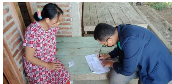
Gambar 2. Pendataan