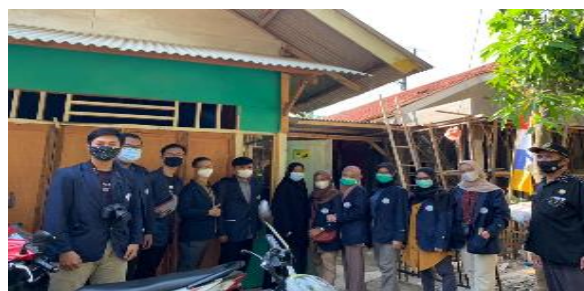
Gambar 3. Evaluasi