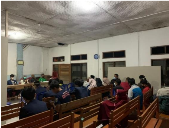
Gambar 6. Sosialisasi Kegiatan