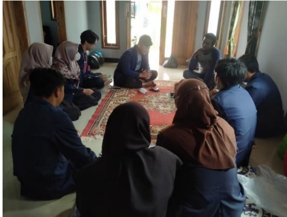
Gambar 5. Perizinan Ketua RW dan RT