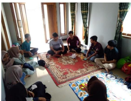
Gambar 4. Perencanaan Kegiatan

Pada tahap ini kami menyusun perencanaan kegiatan bimbingan belajar disesuaikan dengan kondisi masyarakat dan siswa-siswi yang akan terlibat dalam kegiatan.