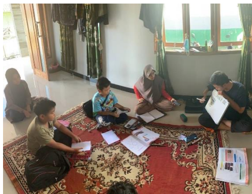
Gambar 7. Pelaksanaan Kegiatan