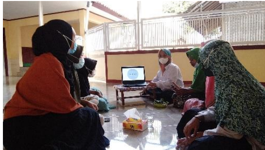
Gambar 4. Sosialisasi Handsanitizer Alami

Selanjutnya sosialisasi hand sanitizer alami dilakukan pada pekan keempat di hari sabtu, dimana sasarannya adalah pemuda dengan rentang usia antara 10-21 tahun. Terdapat tiga tahapan pada saat sosialisasi yakni pre test, penyampaian materi sekaligus praktik, dan post test. Waktu yang dibutuhkan sekitar dua jam untuk menyelesaikan sosialisasi dari tahap awal sampai akhir. Berikut merupakan gambar terkait sosialisasi handsanitizer alami.