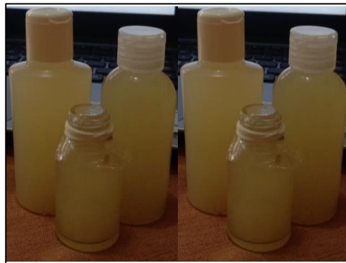
Gambar 5. Produk Hand sanitizer alami

Prosedur pembuatan hand sanitizer diawali dengan ekstraksi daun sirih. Pertama, daun sirih dicuci dan ditiriskan, kemudian dipotong-potong, kemudian ditimbang sebanyak 50 gr dan dimasukkan ke dalam wadah, setelah itu ditambahkan air matang 150-200 mL dan dipanaskan pada suhu 90°C selama 30 menit, setelah itu didinginkan dan disaring, kemudian ditambahkan air matang sampai 200 mL, jadilah ekstrak daun sirih. Untuk membuat 100 mL hand sanitizer alami: Sebanyak 40 mL ekstrak daun sirih dimasukkan ke dalam wadah, kemudian ditambahkan 5-10 mL perasan jeruk nipis yang sudah disaring dan ditambahkan 50-65 mL air matang, kemudian diaduk rata dan dimasukkan ke dalam botol spray dan terakhir dihomogenkan (Listari, Isviyanti, & Triandini, 2020). Berikut merupakan produk hand sanitizer alami berbahan dasar daun sirih dan jeruk nipis