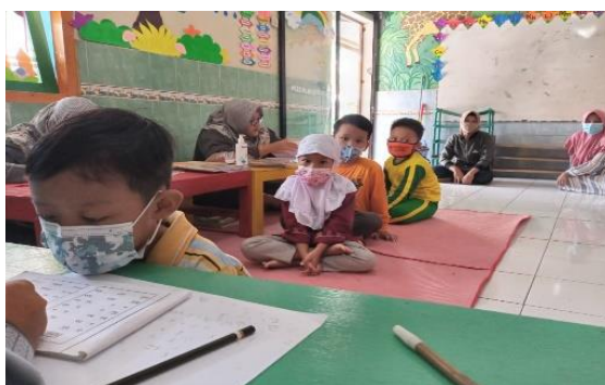
Gambar 3. Proses Belajar Mengajar PAUD Al-Hikmah

Pada pekan ketiga dan keempat dilakukan tahap pelaksanaan program. Proses belajar mengajar yang dilakukan di PAUD Al-Hikmah dilakukan setiap hari senin-jumat mulai pukul delapan sampai sebelas pagi. Pembelajaran dilakukan dengan berbagai metode diantaranya pembelajaran dari rumah dengan media WhatsApp dan videocall. Selain itu terdapat kelompok belajar dimana dalam seminggu dilakukan pertemuan sebanyak dua kali dengan catatan harus mematuhi protokol kesehatan secara ketat. Waktu pembelajaran tatap muka dibatasi dan setiap siswa mempunyai jadwal tersendiri untuk datang ke sekolah sehingga tidak menimbulkan kerumunan. Kemudian di dalam kelas guru maupun siswa dituntut untuk patuh dalam menjaga protokol kesehatan. Berikut merupakan kegiatan belajar mengajar yang telah dilakukan di PAUD Al-Hikmah.