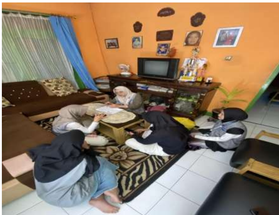
Gambar 4. Penyerahan Dokumen NIB pada pelaku UMKM

Hasil dari kegiatan pendampingan kegiatan pengarahan dan pendampingan pembuatan NIB ini mampu meningkatkan kemampuan dan keterampilan pada pelaku usaha UMKM Dusun II Desa Ciwaruga, terkhsus dalam mempertahankan