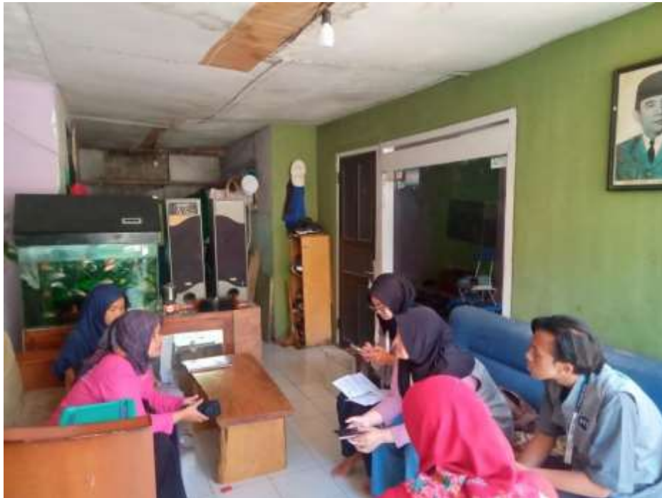
Gambar 3. Pendampingan pembuatan NIB dan pengarahan pentingnya NIB

akun yang telah dibuat. Penyerahan dokumen NIB dilakukan untuk membantu UMKM agar memiliki bukti fisik atau hardfile terkait legalitas usahanya.