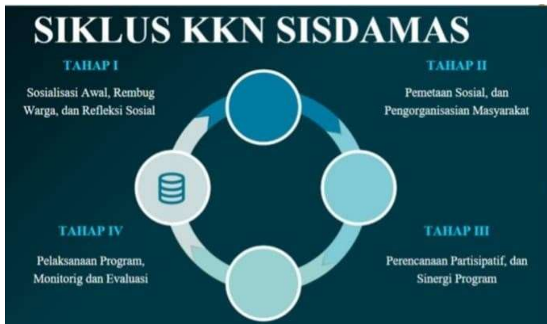
Gambar 1. Siklus Kuliah Kerja Nyata (KKN) Sisdamas