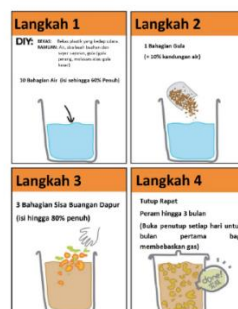
Gambar 1. Proses pembuatan eco-enzyme

Ekoenzim terbuat dari sisa buah atau sayur, air, gula (gula merah, molasses). Pembuatannya membutuhkan kontainer berupa wadah yang terbuat dari plastik, penggunaan bahan yang terbuat dari kaca sangat dihindari karena dapat menyebabkan wadah pecah akibat aktivitas mikroba fermentasi. Tambahkan 10 bagian air ke dalam kontainer (isi 60% dari isi kontainer). Kemudian tambahkan 1 bagian gula (10% dari jumlah air) dan masukkan 3 bagian dari sampah sayuran atau buah-buahan hingga mencapai 80% dari kontainer. Setelah itu tutup kontainer selama 3 bulan dan buka setiap hari untuk mengeluarkan gas selama 1 bulan pertama (Rambe, 2021). Secara singkat proses pembuatan ekoenzim digambarkan sebagai berikut: