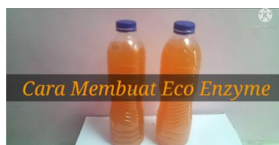
Gambar 4. Video Pelatihan pembuatan ekoenzim