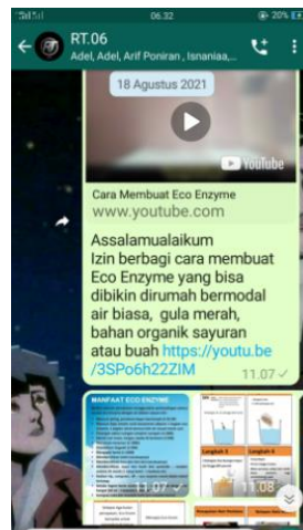
Gambar 3. Pelatihan pembuatan ekoenzim via Whats App

Berikut ini merupakan dokumentasi pelaksanaan Program Pelatihan Pembuatan Eco Enzyme KKN-DR Sisdamas penulis di RT 06 via aplikasi Whats App grup :