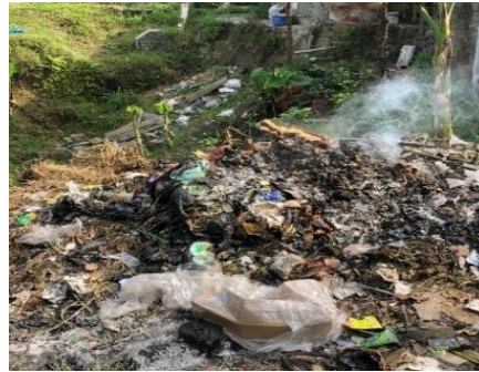
Gambar 1. Kondisi Penumpukan Sampah RW 16 Desa. Cigugurgirang

Di wilayah ini, tidak ada fasilitas resmi yang disediakan oleh pemerintah atau pihak berwenang untuk mengelola sampah yang dihasilkan oleh rumah tangga dan aktivitas lainnya. Akibatnya, masyarakat cenderung mencari solusi instan seperti membakar sampah di lokasi-lokasi yang tidak sesuai, yang bukan hanya merusak kualitas udara tetapi juga berpotensi menimbulkan masalah kesehatan.