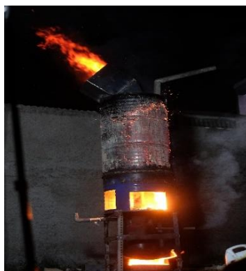
Gambar 2. Alat Pembakaran Sampah RW 16 Desa. Cigugurgirang

incinerator juga memenuhi persyaratan dari Kementerian Lingkungan Hidup sesuai dengan Kep. Men LH No.13/MENLH/3/1995.