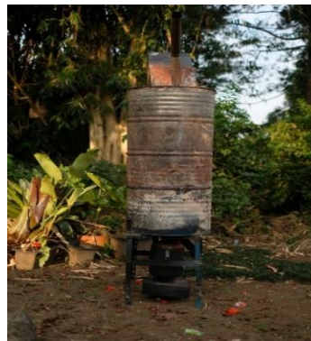
Gambar 4. Kondisi Lahan Untuk Mini Incinerator

Berbeda dengan metode pengelolaan sampah tradisional seperti tempat pembuangan akhir (TPA) yang membutuhkan area besar untuk menampung sampah yang terus bertambah, mini incinerator dirancang untuk bekerja dalam ruang yang jauh lebih kecil. Ini sangat bermanfaat bagi RW 16 Desa.Cigugurgirang, terutama ketika lahan yang tersedia terbatas.