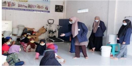
Gambar 3. Edukasi cara memakai masker yang benar dan aturan minimum

Selain itu, kami juga mengajarkan kepada anak-anak cara memakai masker yang benar dan mempraktikkan aturan minimum menjaga jarak saat situasi ramai atau berkerumun (Gambar 3). Tak lupa kami pun membagikan masker kepada anak-anak yang tidak memakai ataupun membawa masker.