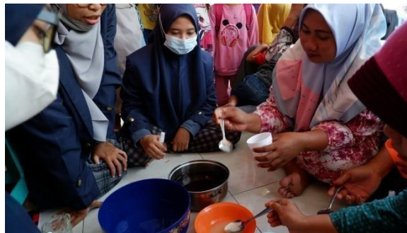
Gambar 13. Ibu-Ibu Mencoba Sendiri Membuat Hand Sanitizer

sangat antusias dan penasaran ingin membuatnya. Bahkan ada yang langsung berbicara kepada kami untuk minta dikirimkan video cara pembuatannya. Maka dari itu, kami mencoba mengupload video kami di youtube agar tidak hanya ibu-ibu yang datang saja yang tahu, tetapi seluruh masyarakat tanjung Anom pun tahu. Untuk ibuibu yang datang saat kami sosialisasi, kami memfasilitasi alat dan bahan untuk membuat hand sanitizer agar ibu-ibu Desa Tanjung Anom dapat mengetahui takaran masing-masing dari ketiga larutan yang digunakan dan mencoba membuatnya sendiri