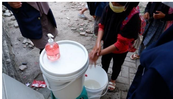
Gambar 2. Fasilitas untuk mencuci tangan

Setelah edukasi ini dilakukan kami meletakkan setidaknya 4 buah ember lengkap dengan keran dan tentunya sabun cuci tangan, supaya anak-anak terbiasa menerapkan protokol kesehatan. Hal ini terbukti berhasil, karena tanpa kami suruh