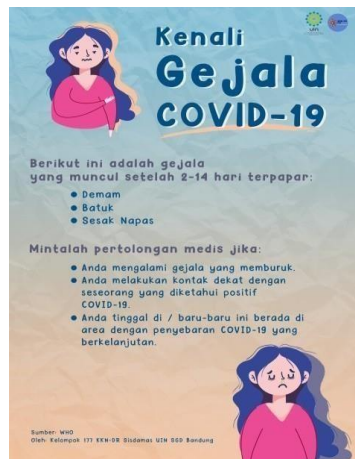
Gambar 4. Poster Mengenai Gejala Covid-19