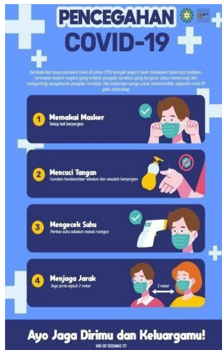
Gambar 5. Poster Pencegahan Covid-19