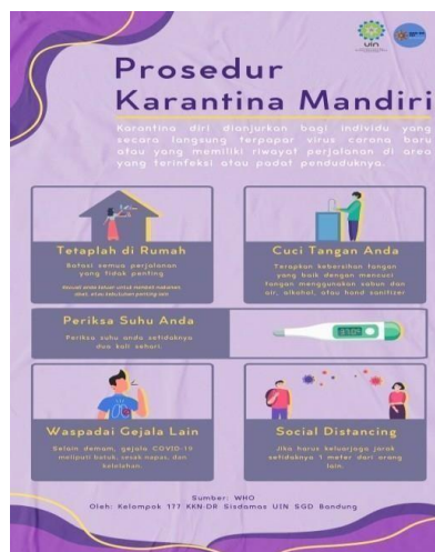
Gambar 8. Poster Prosedur Karantina Mandiri