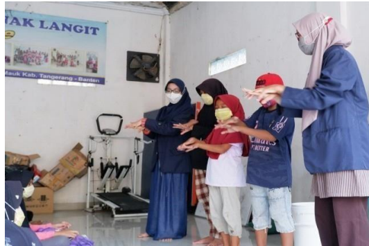
Gambar 1. Edukasi cara mencuci tangan yang benar

dengan keran dan tentunya sabun cuci tangan, supaya anak-anak terbiasa menerapkan protokol kesehatan. Hal ini terbukti berhasil, karena tanpa kami suruh pun mereka mencuci tangannya sendiri (Gambar 2). Setelah ada edukasi ini, kami berharap anak-anak tidak asal-asalan lagi saat mencuci tangan, karena mereka sudah tahu cara mencuci tangan yang benar seperti apa.