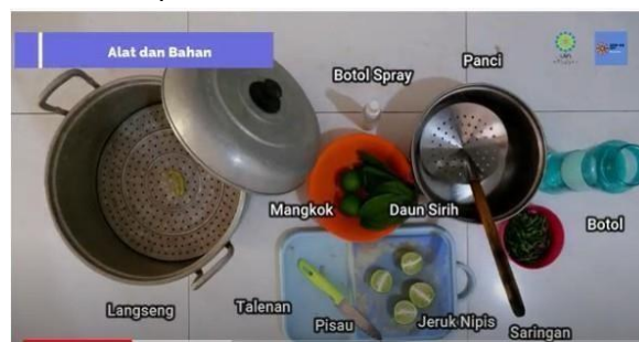
Gambar 11. Alat dan Bahan yang diperlukan

Dari kedua bahan di atas, kita dapat membuatnya menjadi hand sanitizer. Bahan yang diperlukan yaitu daun sirih, jeruk nipis, dan air mineral. Adapun alat yang dibutuhkan yaitu panci, langseng, botol, mangkok, talenan, pisau, botol spray, dan saringan (Gambar 11).