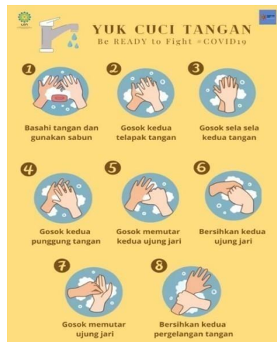
Gambar 7. Poster Cara Mencuci Tangan Yang Benar