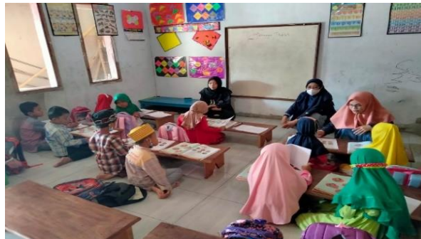
Gambar 4. Proses pembahasan materi pelajaran

nyaman adalah diselingi dengan becandaan, humor dan ice breaking (bernyanyi dan bermain) dan pemberian reward agar anak-anak lebih termotivasi giat belajar.