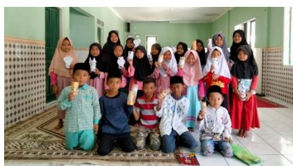
Gambar 5. Anak-anak menunjukan hasil kerajinan

Pada minggu pertama sesuai dengan tahapan pengabdian, mahasiswa KKN DR Sisdamas melakukan refleksi sosial yaitu adanya interaksi terhadap kelompok masyarakat di Desa Kumbung tersebut. Hasil dari tahapan tersebut teridentifikasi bahwa pada sektor pendidikan masih mengalami hambatan dalam proses belajar/mengajarnya. Hal tersebut menjadi salah satu permasalahan yang dihadapi kelompok masyarakat tersebut, yaitu dari segi minat belajar peserta didik yang kurang bersemangat dalam mengikuti proses pembelajaran. Selain itu, ditambah dengan kurangnya bimbingan dari orang tua selaku pengganti guru di sekolah karena orang tu disibukkan dengan pekerjaan masing-masing.