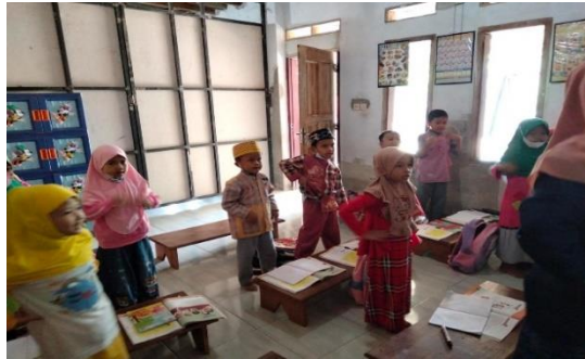
Gambar 2. Anak-anak sedang bernyanyi sebelum pembelajaran dimulai