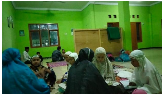
Gambar 3. Anak-anak sedang belajar mengaji

Pelaksanaan kegiatan ini dilakukan selama masa KKN-DR, dimulai tanggal 09 Agustus sampai 26 Agustus 2021, dilaksanakan 3 kali pertemuan dalam satu minggu dari pukul 08-00 – 10-10 yang terbagi dalam 2 kloter dan beberapa lokasi. Dari segi materi pembelajaran untuk siswa sekolah dasar kelas 1 itu sudah ada pegangannya (materinya) dari sekolah, tinggal dikembangkan kembali oleh tenaga pengajar dari peserta KKN sedangkan untuk anak-anak campuran (berbeda tingkatan) lebih menawarkan kepada mereka pelajaran apa yang ingin dipelajari ataupun menanyakan hal apa yang sudah dipelajari sebelumnya, dan rata-rata memang cenderung menginginkan pelajaran matematika secara dasar seperti perkalian, penjumlahan, dan pembagian. Dan tak lupa juga ada program Taman Baca yang mana itu juga sesekali menjadi kegiatan bimbingan belajar supaya anak-anak tidak merasa bosan kemudian diakhir pekannya mengadakan kegiatan senam bareng supaya anak-anak merasa fresh. Selain itu pula program ini didukung dengan kegiatan pengajian yang dilakukan setiap sehabis maghrib dengan pembelajaran Tajwid.