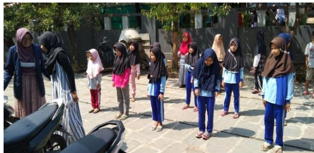
Gambar 6. Senam dan permainan outdoor

Program bimbingan belajar yang dijalankan oleh Mahasiswa KKN DR Sisdamas di Desa Kumbung tersebut menjadi penting dilakukan mengingat bahwa Pendidikan merupakan icon fundamental dalam rangka membenahi kehidupan beragama, berbangsa dan bernegara. Dengan pendidikan, manusia akan memiliki akhlak, moral, ataupun etika yang baik sehingga tercipta kehidupan yang teratur. Dengan pendidikan yang sesungguhnya manusia akan mampu merekonstruksi pola pikirnya. Maka dari itu Pendidikan harus diberikan sejak usia dini. Program bimbingan belajar ini dilaksanakan 3 kali dalam seminggu untuk Sekolah Dasar serta 6 kali dalam seminggu di Majelis dengan metode fun learning. Kata fun mempunyai arti prinsip belajar yang menyenangkan, sedangkan kata learning ini mengajak anak untuk belajar. Pada intinya fun learning itu mengajak peserta didik untuk belajar dengan menggunakan metode yang menyenangkan (Afrila, 2021). Dalam definisi yang lain fun learning adalah salah satu cara pembelajaran dimana pengajar dapat menciptakan suasana hangat dan menyenangkan dalam pembelajaran. Dengan suasana yang hangat dan menyenangkan, apapun yang diajarkan akan mudah diterima dengan senang hati oleh peserta didik.