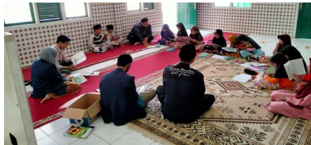
Gambar 7. Anak-anak membaca buku cerita sebelum pembelajaran materi dimulai

anak, serta menumbuhkan kegiatan belajar mandiri. Selain Taman Baca, ada pula kegiatan selingan berupa senam bersama, kegiatan tersebut bermanfaat untuk meningkatkan kebugaran anak. Kegiatan selingan lainnya dilakukan dengan membuat kerajinan yang bahannya berasal dari barang bekas seperti botol plastik dan kardus, kegiatan tersebut bermanfaat demi meningkatkan kreatifitas pada anak. Selain kegiatan yang mengedukasi tersebut, Mahasiswa KKN DR Sisdamas pula mengadakan perlombaan untuk mengasah mental serta kerjasama pada anak.