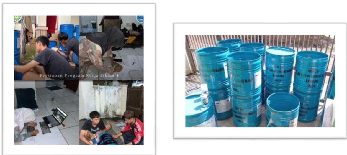
Gambar 8. Penyerahan tong sampah ke setiap RT