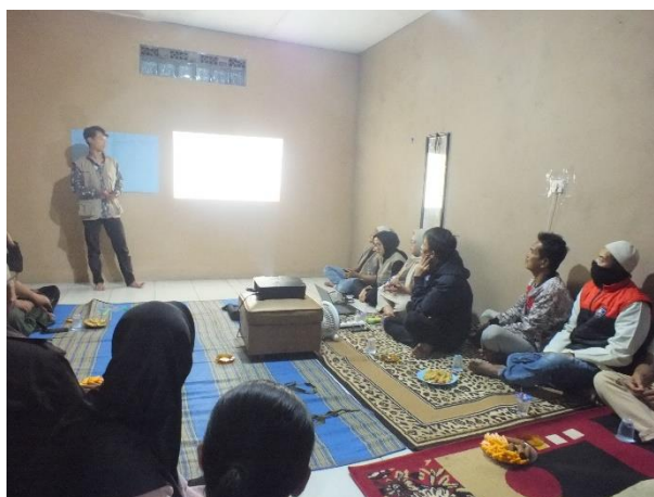
Gambar 1 Rembug warga siklus 3

Setelah melakukan perencanaan, dilanjutkan dengan melakukan perizinan kepada seluruh warga RW 09 dan tokoh agama untuk pembentukan dan pendampingan IRMA secara resmi yang dihadiri oleh warga RW 09 dan tokoh agama.