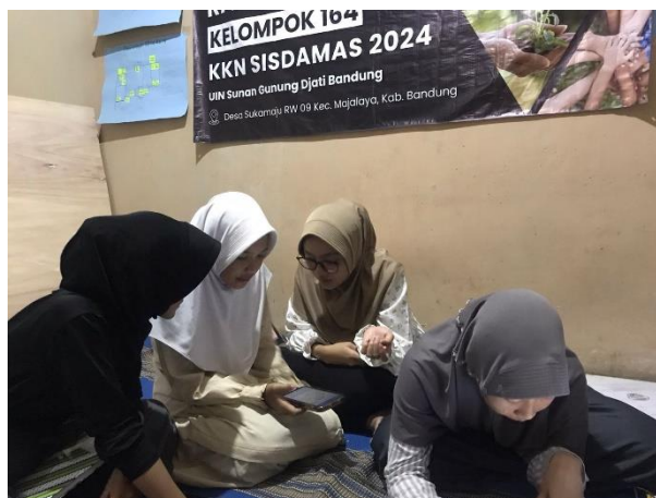
Gambar 3 Pendampingan kepada anggota IRMA