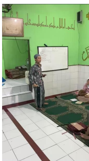
Gambar 2 Pembentukan IRMA

Setelah melakukan tahapan-tahapan di atas, kemudian dilanjutkan dengan pelaksanaan pelantikan IRMA yang dilaksanakan pada malam Selasa setelah sholat magrib berjama'ah yang bertempat di Masjid Al-Kautsar pada pelantikan IRMA tersebut dihadiri oleh anak-anak yang menjadi bagian dari anggota IRMA.