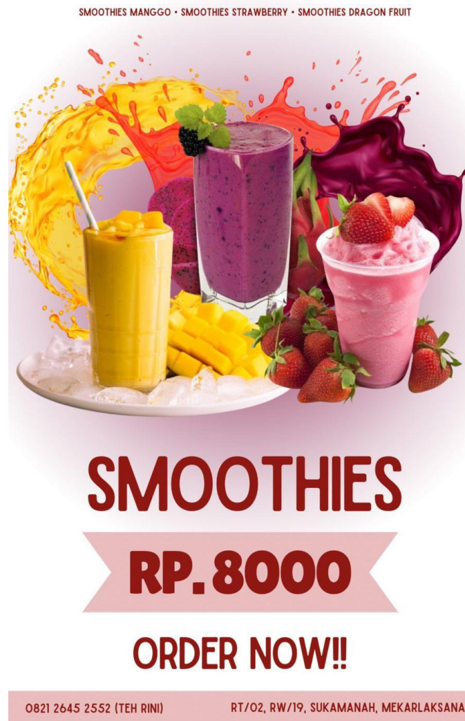
Gambar 1. Pamflet produk penjualan umkm

pembeli terkait produk yang dijual oleh masyarakat sukamanah. hasil pamphlet yang sudah ditunjukkan pada gambar 1.