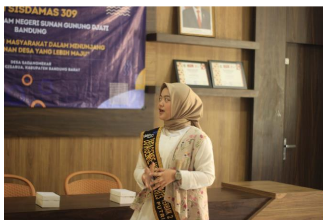
Gambar 5. Penyampaian Materi Sosialisasi Stunting

Materi Sosialisasi Stunting: Sosialisasi dilanjutkan dengan pembahasan mengenai stunting, dampak buruk jangka panjang, dan cara mencegahnya. Duta Genre Kabupaten Bandung Barat memaparkan pentingnya asupan gizi seimbang sejak masa kehamilan hingga usia dua tahun (periode 1000 hari pertama kehidupan).