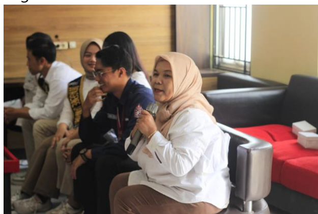
Gambar 6. Sesi Tanya Jawab

Sesi Tanya Jawab: Peserta diberikan kesempatan untuk bertanya seputar anemia dan stunting.