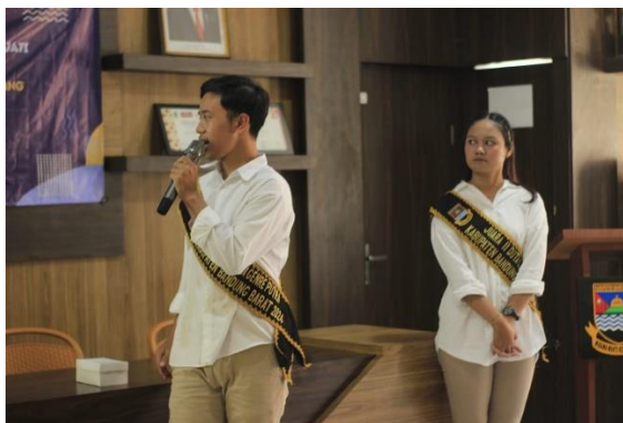
Gambar 4. Penyampaian Materi Sosialisasi Anemia

Materi Sosialisasi Stunting: Sosialisasi dilanjutkan dengan pembahasan mengenai stunting, dampak buruk jangka panjang, dan cara mencegahnya. Duta Genre Kabupaten Bandung Barat memaparkan pentingnya asupan gizi seimbang sejak masa kehamilan hingga usia dua tahun (periode 1000 hari pertama kehidupan).