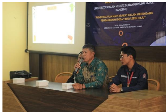
Gambar 2. Sambutan Kepala Desa Sadangmekar