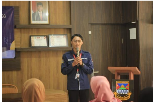
Gambar 1. Sambutan Ketua Duta Genre Kabupaten Bandung Barat