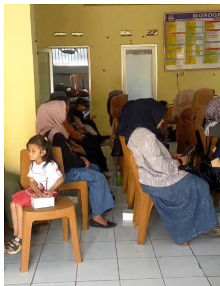
Gambar 3. Masyarakat Desa Sadangmekar yang mengikuti sosialisasi

Materi Sosialisasi Anemia: Penyuluhan disampaikan oleh Duta Genre Kabupaten Bandung Barat dengan menjelaskan tentang anemia, penyebab, gejala, serta cara pencegahannya. Ditekankan pentingnya konsumsi makanan yang kaya zat besi seperti daging merah, sayuran hijau, dan kacang-kacangan, serta pentingnya suplemen zat besi untuk ibu hamil.