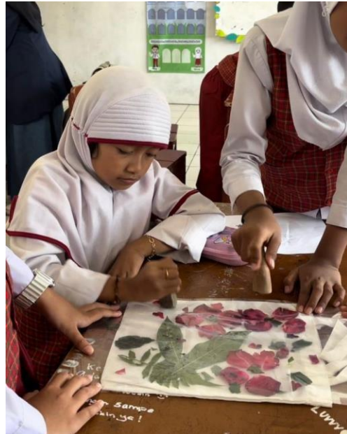
Gambar 1. Pembuatan ecoprint di SDN 01 Jambudipa