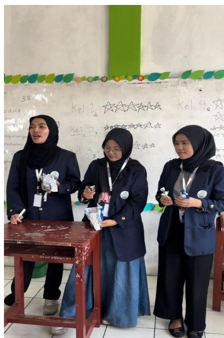
Gambar 3. Pemaparan materi tentang pengelompokan sampah