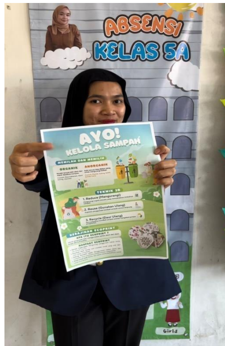
Gambar 4. Memperlihatkan poster tentang pengelolaan sampah