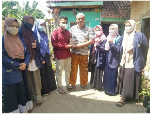
Gambar 7. Pemberian Cenderamata kepada Ketua RT 01