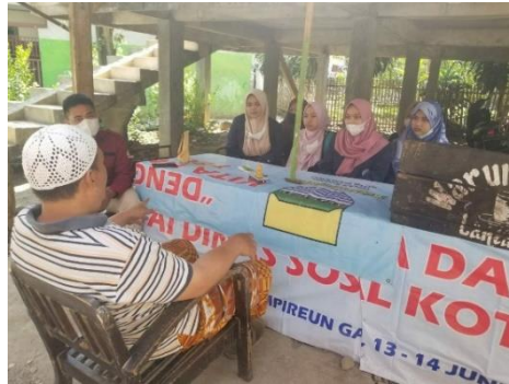
Gambar 4. Perizinan ke Ketua RW 09