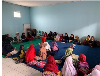
Gambar 1 Kegiatan Mengajar Anak-anak

Pembagian snack sebagai upaya meringankan beban masyarakat dilaksanakan pada tanggal 13 Agustus 2021. Karena masyarakat terdampak oleh pandemi, maka kami membantu meringankan beban dengan membagikan beberapa snack kepada beberapa masyarakat yang membutuhkan. khususnya kepada seorang anak yatim yang sudah tidak lagi memiliki ayah tercinta.