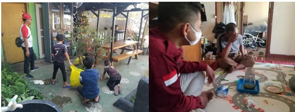
Gambar 5. Sosialisasi bersama warga