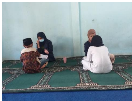
Gambar 2 Peserta yang tidak memiliki HP sedang melaksanakan kegiatan belajar luring

Saat pelaksanaannya di RT 01, penulis membantu mengajar siswa/i yang terkendala tidak memiliki HP sehingga tidak bisa melaksanakan kegiatan pembelajaran secara daring, yang kemudian siswa/i tersebut datang ke posko untuk melakukan pembelajaran luring, dengan memperhatikan protokol kesehatan.