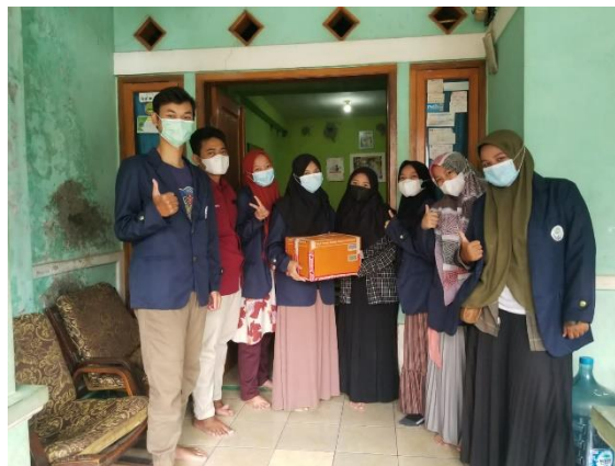
Gambar 9. Pemberian Cenderamata kepada Ketua RW 09