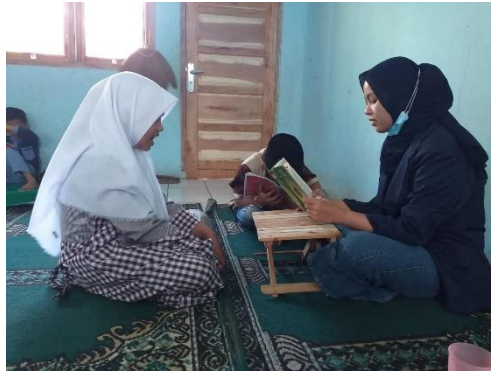
Gambar 2 Kegiatan Belajar Luring Bersama Murid

Selanjutnya kami melaksanakan kegiatan mengajar anak SD dan SMP. Kegiatan ini dilakukan di posko KKN, dilakukan secara luring atau tatap muka dan dilaksanakan 1 kali dalam seminggu. Pada minggu pertama dilaksanakan pada hari jum'at, 6 Agustus 2021. Kegiatan ini berjalan dengan baik dan lancar.