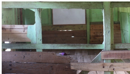
Gambar 1. Kondisi Sekolah

Contohnya kelas 2 dan kelas 6 disatukan dalam satu ruangan tanpa sekat, sehingga proses belajar mengajarpun sedikit terganggu. Penyediaan buku penunjang pembelajaranpun sangat minim dan hanya guru saja yang memegang buku paket. Tidak adanya rencana terkait pembelajaran disetiap harinya. Jadi tidak ada acuan atau formatan yang jelas.