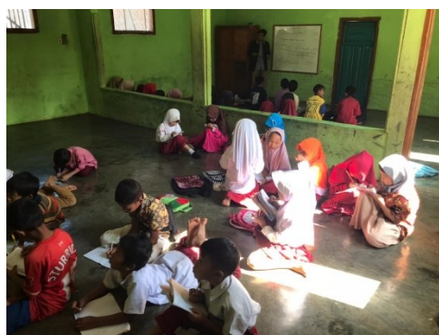
Gambar 2. Kegiatan KBM

Dengan permasalahan tersebut, kami yang berlatar belakang dari pendidikan merancang untuk mengadakan pelatihan bersama guru-guru disana. Kami menyampaikan masalah dan ketidak sesuaian dengan sistem yang digunakan saat ini. Dan pihak sekolahpun menyadari hal itu, sehingga ketika kami merencanakan untuk mengadakan pelatihan, mereka menyetujuinya.