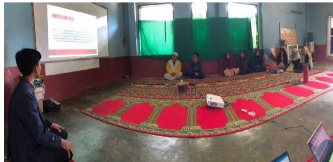
Gambar 3. Kegiatan Pelatihan

Materi yang disampaikan selama pelatihan yaitu pembelajaran terkait kurikulum, prota (program tahunan), prosem (program semester), silabus sampai ke RPP dan cara perancangannya. Kami memfasilitasi setiap guru untuk merancang bersama rencana pembelajarannya, namun dari pihak mereka kurang berantusias.