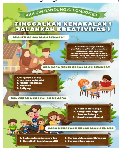
Gambar 5. poster pencegahan kenakalan remaja

Poster digunakan sebagai alat bantu visual yang dipasang di lokasi strategis seperti sekolah-sekolah dan tempat pertemuan masyarakat. Desain poster yang menarik bertujuan untuk meningkatkan kesadaran dan menjadi pengingat terus-menerus tentang nilai-nilai akhlakulil banat, sehingga memudahkan peserta dalam mengingat dan menerapkan materi.