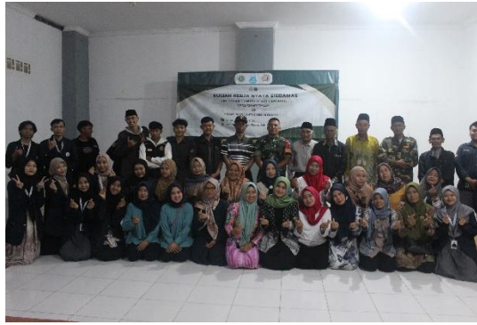
Gambar 1. Melakukan kegiatan rembug warga dan refleksi sosial