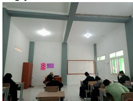
Gambar 4. kegiatan belajar mengajar

Dalam pelaksanaan program Pembelajaran Akhlaku Lil Banat, mahasiswa memusatkan kegiatan pengajaran di SMP Al-Munawaroh Sapan.