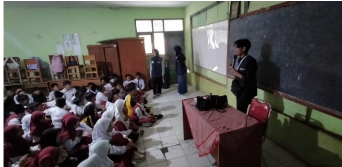
Gambar 6. sosialisasi dan demo poster

Dengan berbagai metode pengajaran ini, program Pembelajaran Akhlaku Lil Banat bertujuan untuk memberikan pemahaman yang mendalam tentang akhlak dan mendorong perubahan perilaku positif di kalangan remaja. Program ini berupaya membekali remaja dengan pengetahuan dan keterampilan yang diperlukan untuk menghindari perilaku negatif dan membuat keputusan bijaksana. Implementasi program di SMP Al-Munawaroh Sapan dan berbagai sekolah serta pertemuan di Dusun 2 menunjukkan pendekatan yang holistik dan partisipatif dalam menangani masalah sosial.