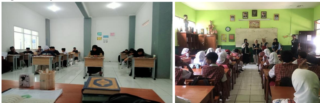
Gambar 3. Pelaksanaan kegiatan

Dalam pelaksanaan program Pembelajaran Akhlaku Lil Banat, mahasiswa memusatkan kegiatan pengajaran di SMP Al-Munawaroh Sapan. Sosialisasi program juga dilaksanakan di berbagai sekolah SD/SMP dan dalam pertemuan remaja di setiap RW di Dusun dua sebagai langkah pencegahan kenakalan remaja. Proses pelaksanaannya melibatkan penyampaian materi akhlak melalui metode presentasi, poster, diskusi interaktif, dan praktik nyata, dengan tujuan memberikan pemahaman yang mendalam dan mendorong perubahan perilaku positif di kalangan remaja.