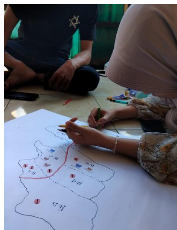
Gambar 2. Melakukan kegiatan pengorganisasian dan pemetaan sosial