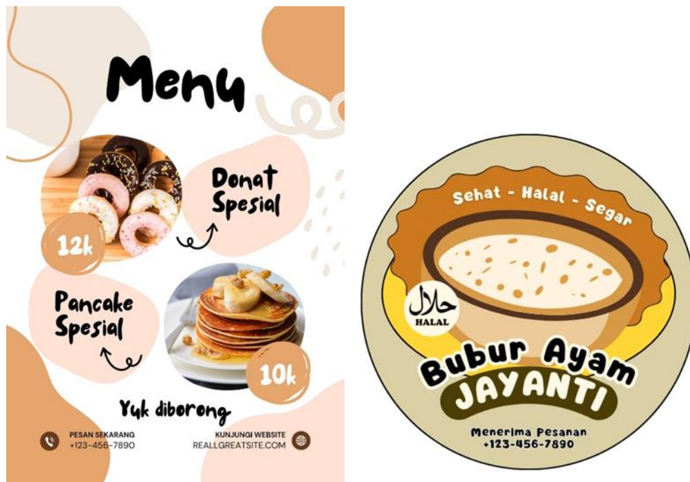
Gambar 3: Contoh Menu dan Logo dari aplikasi Canva

Dengan menggunakan aplikasi Canva ini, Penulis meyakini para pegiat usaha akan semakin kreatif dalam meningkatkan promosi produknya dan diharapkan akan menjadi daya tarik bagi konsumen yang lebih luas jangkauannya.