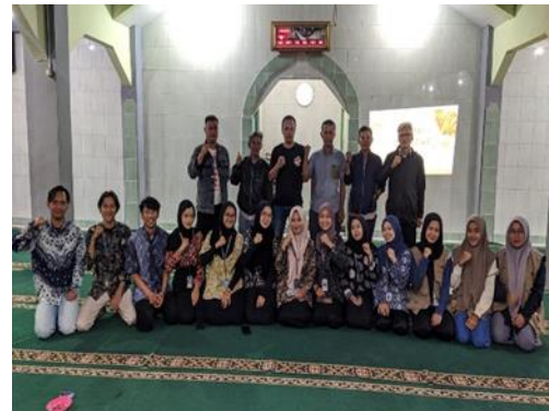
Gambar 2: Sosialisasi digital Marketing

Aplikasi Shopeefood sendiri adalah fitur di aplikasi Shopee yang menyediakan layanan pesan antar makanan dan minuman secara online. Pada sosialisasi ini kami juga membimbing para pegiat UMKM yang akan mendaftarkan produknya di Shopeefood untuk melakukan langkah-langkah pendaftaran seperti dibawah ini :