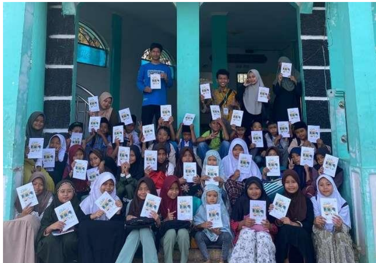
Gambar 4. Dokumentasi Pembagian Buku Mengaji