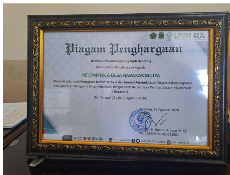
Gambar 6. Piagam Penghargaan Kelompok 6

Kemudian, di akhir KKN Moderasi Beragama diadakanlah namanya Penutupan dan Expo hasil serta karya selama KKN di desa masing-masing. Maka dengan bangga, kami mahasiswa KKN Moderasi Beragama dari Kelompok enam Desa Babakanmulya mendapatkan predikat atau prestasi sebagai Kelompok dengan Inovasi pembelajaran Tajwid terbaik dalam KKN Moderasi Beragama se-Nusantara.