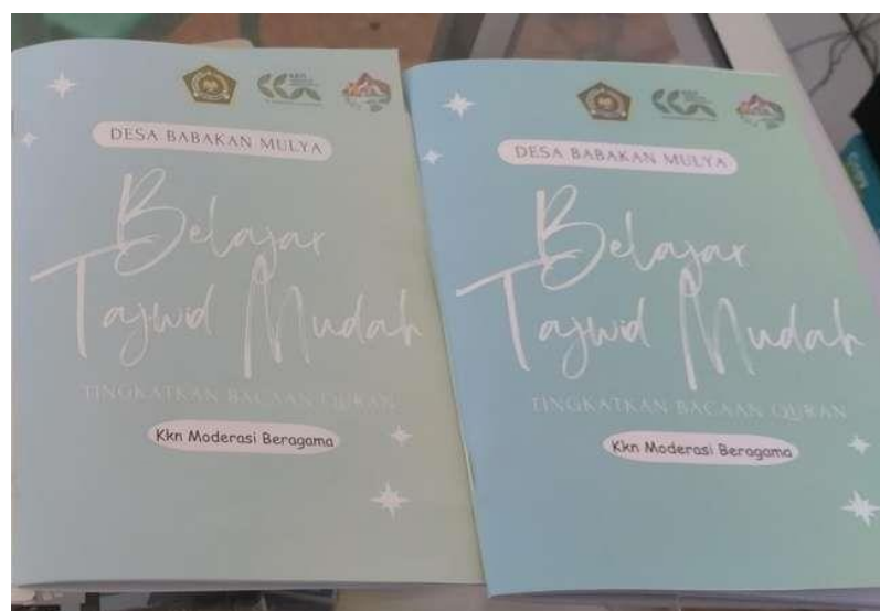
Gambar 6. Buku Belajar Tajwid Mudah

Buku ini bukan hanya untuk saat ini, tetapi juga untuk masa depan. Anak-anak bisa menggunakan buku ini sebagai referensi sepanjang proses pembelajaran mereka. Bahkan, ketika mereka sudah besar, buku ini masih bisa menjadi panduan untuk mengingat kembali kaidah-kaidah tajwid.