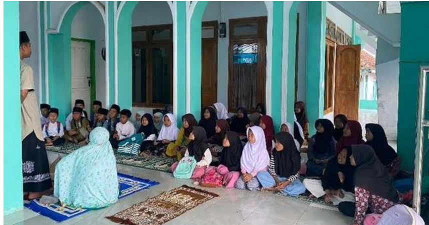
Gambar 2. Hari Pertama Kegiatan Pesantren Kilat

Dalam kesimpulan, penyelenggaraan kegiatan pesantren kilat untuk TPQ yang ada di Dusun Tarikolot Desa Babakanmulya adalah sebuah inisiatif yang bertujuan untuk mengatasi permasalahan khusus yang dihadapi oleh TPQ dalam menemukan metode yang pas untuk mengajar anak-anak. Dengan memahami konteks budaya modern sekarang serta menggunakan pendekatan partisipatif, kegiatan ini memiliki potensi besar untuk meningkatkan minat belajar Al-Qur'an anak-anak Dusun Tarikolot dan menciptakan dampak positif yang berkelanjutan. Artikel ini akan membahas latar belakang penyelenggaraan pesantren kilat di TPQ Al-Hidayah, Dusun Tarikolot, Desa Babakanmulya, tujuan dan manfaat serta bentuk pemberdayaan yang dilaksanakan.