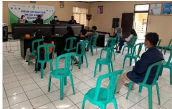
Gambar 3. Presentasi materi di aula Desa Sukajaya

3) Sosialisasi. Kegiatan sosialisasi diadakan pada hari Minggu, tanggal 31 Agustus 2021 yang bertempat di aula kantor Desa Sukajaya. Pada tahapan ini dilakukan penyampaian materi menggunakan powerpoint berkaitan pemanfaatan hijauan melalui fermentasi menggunakan EM4. Setelah penyampaian materi dilakukan sesi tanya jawab.