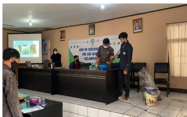
Gambar 4. Pembuatan silase sederhana

4) Pelatihan. Kegiatan pelatihan yang dilaksanakan langsung setelah kegiatan sosialisasi mengajak partisipan untuk ikut secara langsung bagaimana proses pembuatan silase secara sederhana.