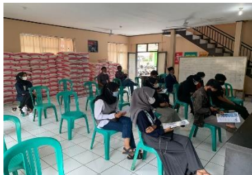
Gambar 5. Pengisian kuesioner

5) Evaluasi Kegiatan. Tahapan evaluasi dilaksanakan setelah sesi tanya jawab bagian kedua. Pada tahapan ini partisipan diberi lembar kuesioner untuk menilai poin-poin evaluasi berdasarkan indikator penilaian yang tersedia. Partisipan cukup memberi tanda centang pada kolom tabel yang paling sesuai.