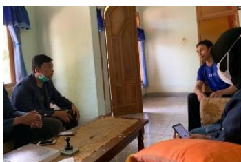
Gambar 2. Diskusi dengan aparat setempat

2) Pencanangan. Program sosialisasi pemanfaatan hijauan melalui fermentasi menggunakan EM4 pada mulanya dibahas dengan Ketua RW Haur Lawang dan dicanangkan untuk dilaksanakan hanya dalam ruang lingkup internal masyarakat Haur Lawang. Beliau pun nampak antusias dan tertarik terhadap program tersebut. Akan tetapi, hal tersebut urung dilakukan karena berdasarkan penuturan beliau dikemudian hari, masyarakat Haur Lawang tidak dapat mengikuti kegiatan tersebut dikarenakan masyarakat yang kurang antusias dan program RW yang terhitung padat.