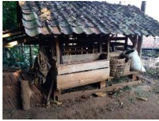
Gambar 1. Kandang Cipari (atas) dan Kubang (bawah)

Sumber pakan ternak di Desa Sukajaya memang tersedia dalam jumlah yang mencukupi kebutuhan pakan harian ternak. Akan tetapi, ketersediaan pakan tersebut tidak tersedia sepanjang waktu. Berhubung pengabdian dilaksanakan pada musim hujan, sehingga ketersediaan pakan masih mencukupi. Permasalahan pakan baru akan muncul pada musim kemarau, dimana rumput lebih jarang tumbuh dan mudah mengering. Oleh karena itu, masalah tersebut menarik untuk dikaji lebih lanjut. Solusi yang akan digarap berdasarkan diskusi internal kelompok KKN Desa Sukajaya berupa pengadaan sosialisasi program pemanfaatan hijauan melalui fermentasi menggunakan EM4 sebagai teknologi perbaikan kualitas mutu pakan ternak. Dengan begitu, peternak di Desa Sukajaya dapat mengumpulkan sumber pakan ternak ketika musim hujan untuk disimpan dan digunakan ketika musim kemarau tanpa menurunkan kualitas nutrisi pada pakan.