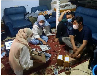
Gambar 4. Presentasi laporan keuangan