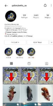
Gambar 1. Instagram ikan cupang

Dengan di adakannya acara giveaway lalu dengan mengadakan sistem penjualan dengan konsep lelang, interaksi sekaligus angka penjualan barang dapat dilihat ada peningkatan dari sebelumnya. Dengan menggunakan sistem sebelumnya yaitu penjualan dengan konsep flashdeal atau flashseal dalam seminggu penjualan ikan hanya berada di angka 1-5 ekor saja. Lalu, dengan menggunakan sistem lelang penjualan ikan terlihat ada peningkatan, dengan menggunakan sistem lelang dalam sehari minimal ada 9 ikan yang terjual dengan harga bervariasi, ditambah lagi dengan mengadakan acara giveaway sehingga interaksi baik itu followers atau pengikut dan daya beli dari pembeli ada peningkatan.