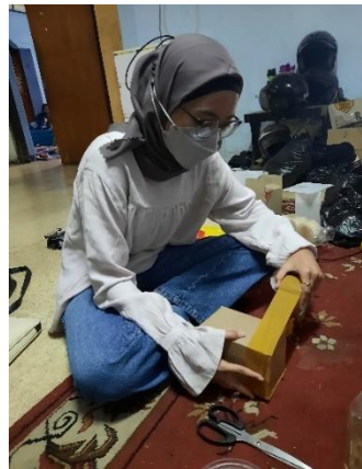
Gambar 2. Bimbingan tata cara pengemasan