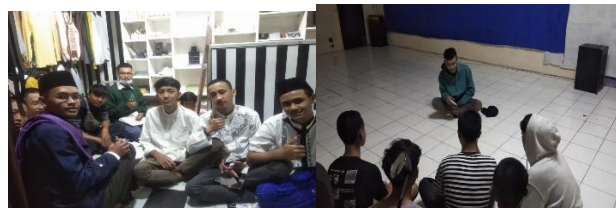
Gambar 3. Koordinasi dengan para pemuda RW 03