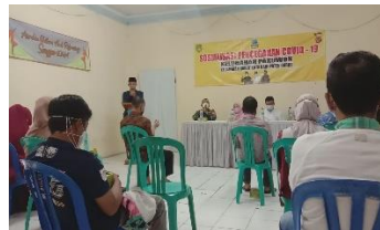
Gambar 2. Kegiatan sosialisasi pencegahan covid-19