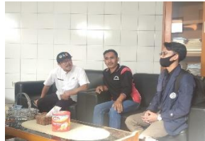
Gambar 1. Koordinasi dengan Kepala Kelurahan dan Ketua RW 03