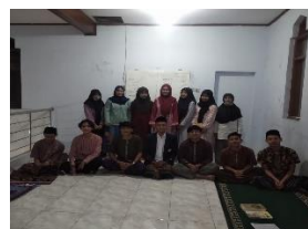
Gambar 4. Pemberian materi tentang pola hidup sehat kepada santri/pelajar