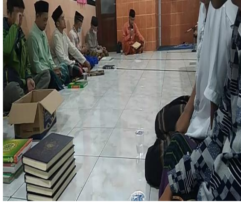
Gambar 5. Pemberian materi keagamaan tentang pola hidup sehat kepada masyarakat