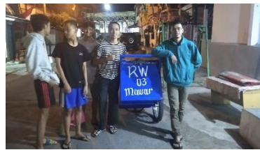
Gambar 6. Kegiatan pemungutan sampah

GEMS ini pemberdayaan yang dilakukan cukup berjalan dengan baik dan lancar dimana para masyarakat khususnya mendapatkan edukasi yang sangat berguna mengenai pola hidup sehat dan mengetahui bagaimana virus covid-19 ini menyebar serta cara mencegahnya. Hal ini sebagaimana dilakukan ketika penulis melaksanakan kegiatan sosialisasi kepada masyarakat mengenai berbagai hal tentang covid-19 dengan Tim Satgas Covid-19 sebagai narasumbernya. Sejalan dengan yang dikatakan oleh Tim Satgas Covid-19 bahwa Covid-19 merupakan virus yang menyerang sistem pernapasan manusia yang dapat mengakibatkan penderitanya mengalami gangguan pernapasan, demam, pilek bahkan kematian. Penularan Covid-19 begitu cepat sehingga organisasi kesehatan dunia (WHO) menetapkan virus corona sebagai pandemi.