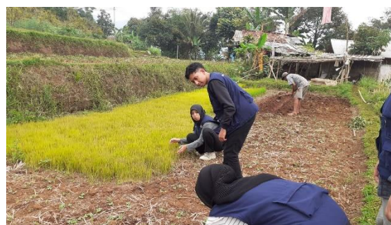
Gambar 3 Praktik Langsung Menanam Padi

Adapun kegiatan tambahan yang dilakukan yakni kegiatan praktik langsung. Kegiatan Praktik Langsungnya itu adalah menanam padi. Mahasiswa KKN turut serta dalam kegiatan menanam padi Bersama Masyarakat RW 03. Kegiatan ini tampak jelas pada gambar berikut.