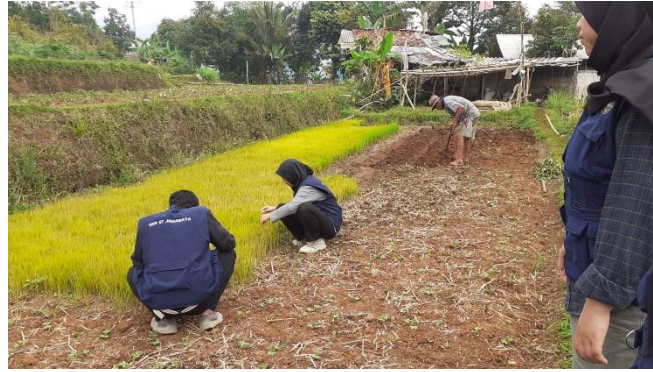
Gambar 2. Penanaman Padi