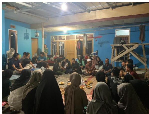
Gambar 1. Rembug Warga

Siklus Pertama yaitu Refleksi Sosial yang dilakukan selama kurun waktu 1 minggu dari tanggal 11 s.d. 16 Juli 2023. Pada siklus ini kami melakukan silaturahmi ke masyarakat sekaligus melakukan sosialisasi kegiatan KKN SISDAMAS yang mana akan dilaksanakan selama 40 hari. Tidak hanya melakukan sosialisasi kegiatan KKN, kami juga menggali informasi dari Masyarakat terkait permasalahan yang terjadi di Desa Jagabaya khususnya di Dusun 1 dan Dusun 3. Hasil dari kegiatan tersebut, kami mengetahui kultur di dusun tersebut, kegiatan apa saja yang dilakukan Masyarakat, serta mengetahui permasalahan yang ada di Masyarakat. Tanggal 14 Agustus 2023 dilakukan rembug warga yang dihadiri oleh Ketua RW, Ketua RT, serta Masyarakat Desa Jagabaya yang ada di Dusun 1 dan Dusun 3. Topik yang dibahas pada kegiatan rembug warga yaitu terkait potensi-potensi, serta permasalahan yang ada di Masyarakat Dusun 1 dan Dusun 3 Desa Jagabaya. Selain membicarakan mengenai potensi dan permasalahan, dibahas juga mengenai harapan Masyarakat dengan adanya Kegiatan KKN SISDAMAS ini.