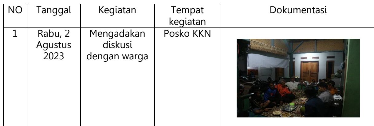
Tabel 1. Pelaksanaan kegiatan di RW 9 Dan RW 10 Desa Nagrak