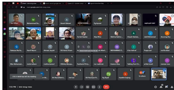
Gambar 3. Pelaksanaan program secara talian (online) melalui aplikasi Gmeet