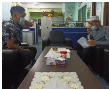
Gambar 1. Wawancara bersama Kepala Sekolah SK Ibnu Khaldun