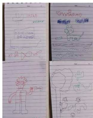
Gambar 5. Hasil Menggambar Kreasi Anak