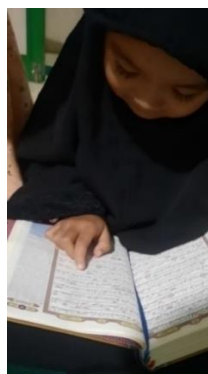
Gambar 2. Anak sedang Mengaji Al-Qur'an

Setiap anak pasti sudah memiliki pengajarnya masing-masing. Dan disini para anggota Kelompok 145 memperhatikan dan membenarkan jika ada bacaan anak yang keliru.