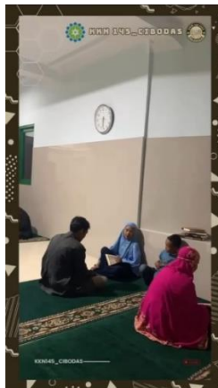
Gambar 1. Suasana Mengajar Mengaji di Masjid Al-Hasan

Kegiatan diawali dengan melantunkan surat Al-Fatihah bersama-sama sebelum para anak-anak menghampiri salah satu anggota Kelompok 145 yang akan mengajari mengaji. Setelah melantunkan surat Al-Fatihah selesai para anak akan menghampiri anggota Kelompok 145 dan siap untuk mengaji.