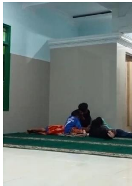
Gambar 3. Anggota KKN 145 sedang Bercerita Kisah Nabi

Setelah mengaji dengan metode iqro selesai, para anak memilih minat atau kegiatan yang ingin dilakukan sembari menunggu adzan Isya. Metode permainan dilaksanakan disini. Anak-anak terkadang memiliki kebebasan untuk menentukan permainan apa yang akan dilakukan. Karena konsep yang kami lakukan adalah "Bermain sambil Belajar". Kegiatan yang dilakukan oleh para anak adalah bercerita kisah nabi, menceritakan terjemahan Al-Qur'an, bermain tebak-tebakan, menulis surat yang ada di Al-Qur'an, menggambar, dan belajar mengenai berbagai pengetahuan umum ( sharing ). Dalam melakukan permainan terkadang anggota Kelompok 145 memberikan sebuah hadiah untuk menambah rasa semangat anak dalam belajar terutama Al-Qur'an.