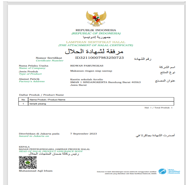
Gambar 7. Sertifikat Halal Keripik Pisang

Kemudian sesudah terbit Sertifikat Halal yang harus di ingat masa berlaku sertifikat halal berlaku sejak diterbitkannya oleh BPJPH dan tetap berlaku sepanjang tidak terdapat perubahan komposisi bahan dan/atau proses produk halal.