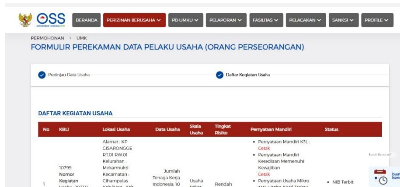
Gambar 4. Penginputan Data Ke Akun OSS untuk Pembuatan Nomer Induk Berusaha

Online Single Submission (OSS) adalah sistem perizinan berusaha terintegrasi secara elektronik yang dikelola oleh Kementerian Investasi/BKPM. Adapun NIB adalah identitas berusaha berbentuk 13 (tiga belas) digit angka acak yang diberi pengaman dan disertai dengan tanda tangan elektronik. Fungsi dari Nomer Induk Berusaha ini yaitu sebagai identitas resmi badan usaha atau usaha perseorangan untuk legalitas badan usaha yang terdaftar di pemerintah. NIB juga sebagai salah satu syarat pengajuan sertifikat halal gratis bagi pelaku usaha menengah dan kecil.