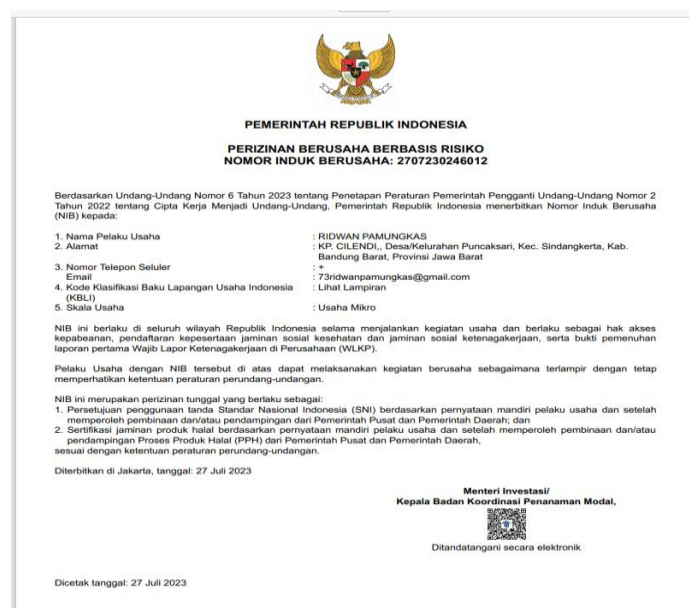
Gambar 6. Hasil cetak Nomor Induk Berusaha (NIB)

Pelaku usaha yang didampingi oleh pendamping halal adalah bapak Ridwan pamungkas dengan jenis produk yang diajukan berupa produk Industri Kerupuk, Keripik, Peyek Dan Sejenisnya dengan merek dagang yaitu Keripik Pisang Arcelio. Daerah pemasaran produk keripik ini beralamat di SMAN 1 Sindangkerta, Desa Puncaksari. Usaha dari bapak Ridwan Pamungkas ini akan dibantu untuk dibuatkan sertifikat halal namun belum memiliki dokumen Nomor Induk Berusaha (NIB). Oleh karena itu pendamping membantu membuat Nomor Induk Berusaha (NIB), yang mana NIB ini merupakan salah satu syarat untuk mengajukan sertifikat halal. Produk yang diajukan dalam sertifikasi halal yang pendamping halal proses adalah Keripik Pisang.