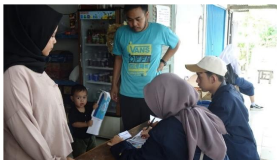
Gambar 3. Mendatangi Pelaku Usaha Untuk Melakukan Pendataan

Mendatangi Pelaku usaha merupakan kegiatan untuk melakukan pendataan dan validasi terhadap produk yang akan diajukan sertifikat halal. Dalam hal ini, pelaku usaha menyerahkan KTP kepada P3H untuk pembuatan NIB bagi yang belum memiliki NIB yang nantinya NIB tersebut dimasukkan kedalam akun SiHalal bagi pelaku usaha untuk pengajuan sertifikat halal gratis. Kemudian, P3H akan bertanya mengenai jenis produk yang diajukan sertifikat halal dan bahan-bahan yang digunakan dalam pembuatan produk. Selanjutnya, pendamping mendokumentasi produk yang akan diajukan sertifikat halal.