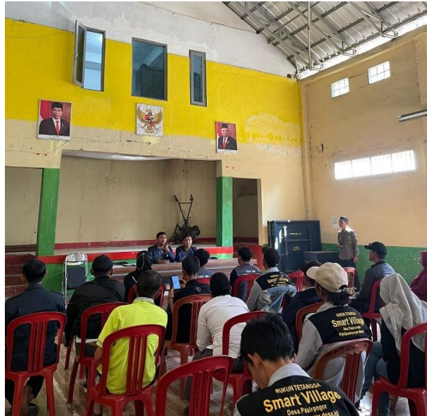
Gambar 2. Sosialisasi Program Sertifikasi Halal Gratis Kepada Warga Kecamatan Sindangkerta

Sosialisasi Program Sertifikat Halal Gratis dilakukan kepada warga atau pelaku usaha yang berada di kecamatan sindangkerta. Sosialisasi dilakukan di kantor desa puncak sari dengan mengundang seluruh warga yang berada di desa tersebut. Kegiatan ini memberikan pengetahuan kepada pelaku usaha mikro dan kecil mengenai pentingnya sertifikat halal dan label halal bagi produk usahanya