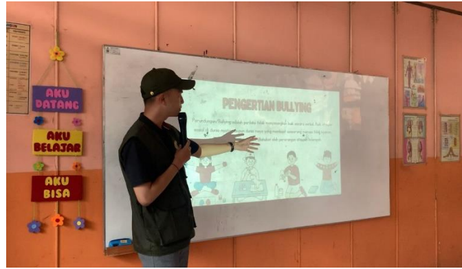
Gambar 2. Pemateri menyampaikan pembahasan terkait dampak psikologis bullying