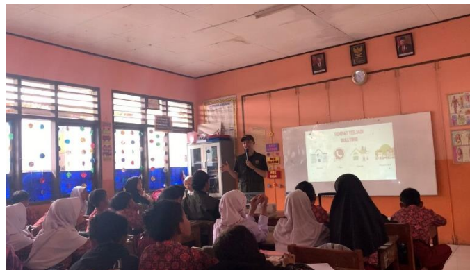
Gambar 1. Penyampaian materi pertama: Dampak Psikologis Bullying

Pembekalan materi dari aspek psikologis dan hukum menjadi upaya untuk mencegah tindakan bullying . Aspek psikologis berperan dalam menumbuhkan kesadaran akan dampak-dampak negatif yang akan diterima korban sehingga siswa dapat mengedepankan sifat empati dan saling menghargai antar sesama. Pembekalan dari aspek hukum juga sebagai salah satu tindakan preventif selaras dengan tujuan hukum pidana yakni untuk menakut-nakuti masyarakat agar tidak melakukan tindak pidana. Berikut adalah beberapa dokumentasi pada kegiatan penyuluhan bullying di SDN Simpang: