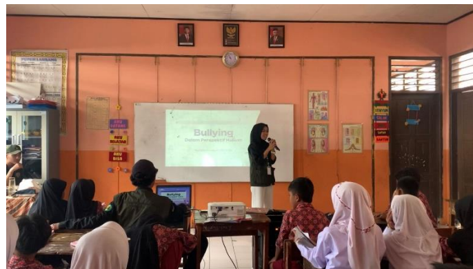
Gambar 3. Penyampaian materi kedua: Bullying dalam Perspektif Hukum