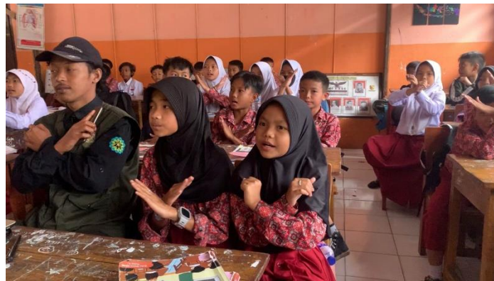
Gambar 6. Siswa-siswi SDN Simpang peserta penyuluhan menyuarakan jargon “say no to bullying”