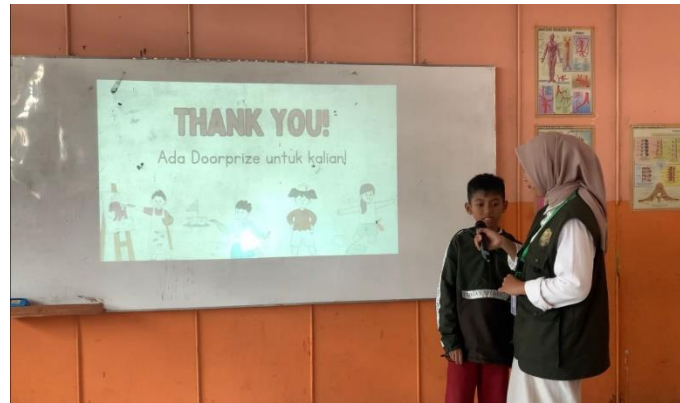
Gambar 5. Sesi tanya jawab