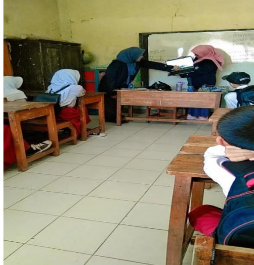
Gambar 2. Penyampaian materi Google Form kepada para siswa siswi kelas VI MI YPPI Baros Mekarjaya

Gambar 2, memeperlihatkan pemateri yang sedang menjelaskan dan menunjukan beberapa hasil perobaan yang sudah mengisi Google Form, dengan memperlihatkan diagram hasil Google Form.