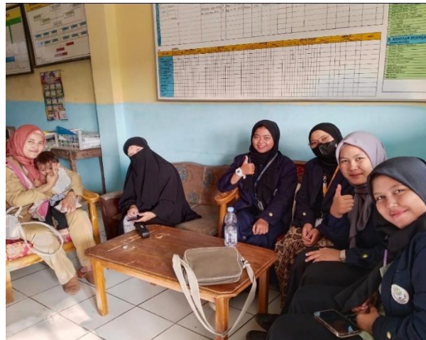
Gambar 1. Diskusi proker dengan staf pengajar MI YPPI Baros Mekarjaya

tahap pertama, berlangsungnya diskusi dasar dengan pembahasan seputar pendekatan dan mengetahui beberapa struktur organisasi, tata tertib serta kebiasaan budaya dalam sistem pengajaran yang terdapat di MI YPPI Baros Mekarjaya.