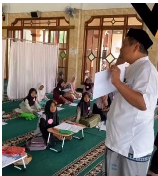
Gambar 11. Lomba Membuat Kaligrafi

Selain itu, secara tidak langsung dapat memakmurkan masjid dan masyarakat disekitar lingkungan masjid serta membangun komunikasi dalam rangka silaturahmi antara sesama masyarakat lainnya. Hal ini memberi dan berbagi ilmu Agama pada keadaan dan situasi tertentu. Kegiatan memperingati Tahun Baru Islam/ 1 Muharram 1445 H yang diselenggarakan di Desa Ciasem tengah, khususnya wilayah Dusun Marjim dan Tanjung Baru pada tanggal 29 Juli 2023, meliputi kegiatan lomba muharram anak-anak dan remaja serta kegiatan tabligh akbar. Pada pukul 08.00 WIB, dimulai kegiatan lomba anak-anak serta remaja Dusun Marjim dan Dusun Tanjung Baru meliputi Lomba adzan, Lomba Tahfidz Qur'an, Lomba Tilawah Qur'an, Lomba membuat kaligrafi dan Lomba Ceramah. Dengan adanya kegiatan keagamaan ini dapat menumbuhkan sifat islami dan akhlak mulia pada anak-anak, membentuk karakter religius anak, menambah pengetahuan anak, meningkatkan kualitas dalam kegiatan keagamaan serta memberikan perubahan yang lebih baik di dalam masyarakat. Citra remaja masjid akan menjadi positif dengan melakukan kegiatan positif dan bermanfaat dalam masyarakat.