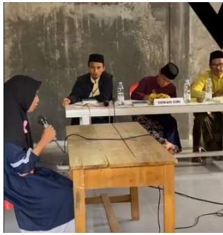
Gambar 13. Lomba Tahfidz Qur'an