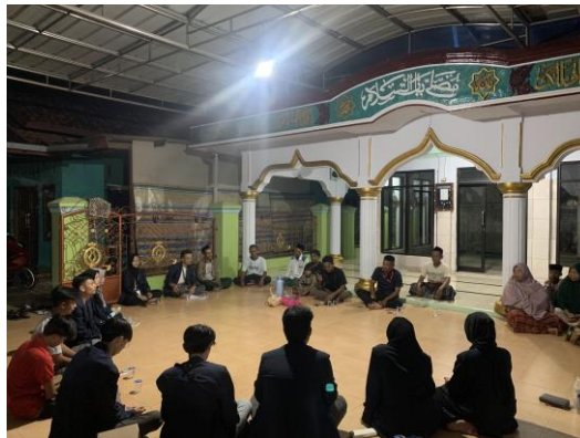
Gambar 2. Rapat Perencanaan Program

Pertama , penggalan informasi terkait kemampuan religius ibu-ibu di lingkungan keluarga dan masyarakat. Kedua , melakukan pengajian rutin setiap minggu dan mendorong Ibu-Ibu untuk berpartisipasi dalam pengajian di lingkungan masjid/musholla Dusun Marjim. Ketiga , mendorong masyarakat untuk melaksanakan salat berjama'ah khususnya untuk laki-laki. Keempat , membantu memakmurkan Masjid dan Musholla dengan cara mengikuti dan berpartisipasi dalam program-program yang ada di DKM At-Taubah, Musholla Babussalam, Musholla Al-Fadhllillah dan Musholla Al-Mukhlisin.