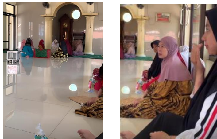
Gambar 7. Pengajian Rutin di Musholla Al-Fadhllillah

Pada hari Senin, 31 Juli 2023, kami melaksanakan pengajian rutin yang berlokasi di Musholla Babussalam RT. 29, Dusun Marjim, dimulai pukul 13.00 WIB, dihadiri oleh Ibu-Ibu Dusun Marjim dan Peserta KKN Sisdamas 330 UIN Sunan Gunung Djati Bandung. Pengajian tersebut menggunakan sistem mendengarkan ceramah dari Ustadz dan Ustadzah Dusun Marjim.