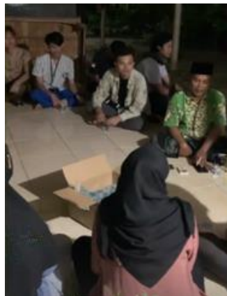
Gambar 1. Refleksi Sosial ( Social Reflection )

Dari hasil Sosialisasi pada kegiatan siklus 1 (Refleksi Sosial) mendapatkan informasi mengenai kebutuhan masyarakat pada Dusun Marjim, Desa Ciasem Tengah yaitu dibutuhkannya keterikatan emosional dengan rasa cinta terhadap masjid/musholla nya yang akan membuat semangat dalam diri kita sendiri, sehingga timbul kemauan untuk menumbuhkan dan mengembangkan karakter religius kita. Disinilah sebagai remaja masjid dapat memberikan contoh dengan sering datang ke masjid untuk melaksanakan salat berjama'ah, berpartisipasi dalam kegiatan beragama Islam; Kebutuhan rohani dan jasmani dengan diadakannya pengajian rutin, tabligh akbar dan silaturahmi dalam mewujudkan masyarakat yang damai. Pada dasarnya kegiatan pengajian rutin dan tabligh akbar merupakan konsep untuk membangun komunikasi dalam bentuk silaturahmi kepada sesama warga. Dalam hal memberikan serta berbagi ilmu agama pada situasi dan kondisi tertentu.