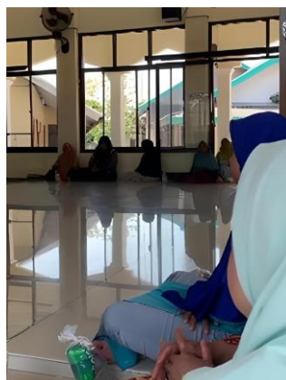
Gambar 5. Pengajian di Musholla Al-Fadhllillah

Pada hari Senin, 24 Juli 2023, kami melaksanakan pengajian rutin ibu-ibu Dusun Marjim berlokasi di Musholla Babussalam, dimulai pukul 13.00 WIB, dihadiri oleh Ibu-Ibu Dusun Marjim dan Peserta KKN Sisdamas 330 UIN Sunan Gunung Djati Bandung. Pengajian tersebut menggunakan sistem mendengarkan ceramah dari Ustadz dan Ustadzah Dusun Marjim dengan topik "Tolong Menolong".