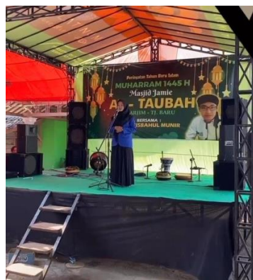
Gambar 15. Lomba Ceramah

Masyarakat yang religius tergambar jelas dari pola perilaku, interaksi sosial, dan pengamalan ajaran agama oleh orang-orang yang berada dalam satu lingkungan tersebut. Ajaran agama telah menjadi bagian suatu masyarakat dan diterapkan secara nyata dalam kehidupan, baik kehidupan pribadi maupun dalam kehidupan bermasyarakat. Ananto menerangkan religius seseorang terwujud dalam berbagai bentuk dan dimensi, yaitu: a.) Seseorang boleh jadi menempuh religiusitas dalam bentuk penerimaan ajaran-ajaran agama yang bersangkutan tanpa merasa perlu bergabung dengan kelompok atau organisasi penganut agama tersebut. b.) Pada aspek tujuan, religiusitas yang dimiliki seseorang baik berupa pengamatan ajaran-ajaran maupun mengabungkan diri ke dalam kelompok keagamaan. Dapat ditarik kesimpulan dimensi religius meliputi aspek intrinsik dan aspek ekstrinsik, serta sosial intrinsik dan sosial ekstrinsik. (Zusnani, 2012 )