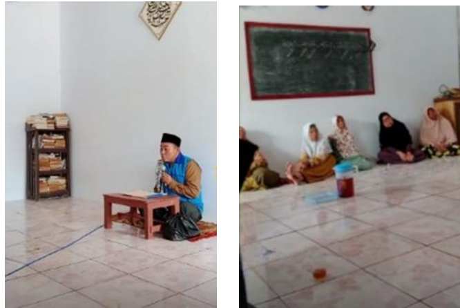
Gambar 4. Pengajian Rutin di Musholla Babussalam

Pada hari Jum'at, 21 Juli 2023, kami melaksanakan program yaitu pengajian rutin ibu-ibu Dusun Marjim yang telah disetujui oleh Tokoh Agama dan Tokoh Masyarakat Dusun Marjim. Pengajian rutin ini berlokasi di Musholla Al-Fadhllillah, dimulai pukul 13.00 WIB, dihadiri oleh Ibu-Ibu Dusun Marjim dan Peserta KKN Sisdamas 330 UIN Sunan Gunung Djati Bandung. Pengajian tersebut menggunakan sistem mendengarkan ceramah dari Ustadz dan Ustadzah Dusun Marjim dengan topik "Pentingnya Berdzikir".