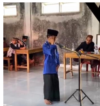
Gambar 12. Lomba Adzan