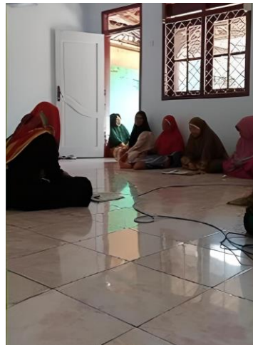
Gambar 6. Pengajian Rutin di Musholla Babussalam

Pada hari Senin, 31 Juli 2023, kami melaksanakan pengajian rutin yang berlokasi di Musholla Babussalam RT. 29, Dusun Marjim, dimulai pukul 13.00 WIB, dihadiri oleh Ibu-Ibu Dusun Marjim dan Peserta KKN Sisdamas 330 UIN Sunan Gunung Djati Bandung. Pengajian tersebut menggunakan sistem mendengarkan ceramah dari Ustadz dan Ustadzah Dusun Marjim.