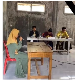
Gambar 14. Lomba Tilawah Qur'an