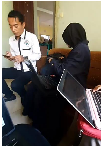
Gambar 2. Pemberian Arahan dan Bimbingan dari Aparat Desa Singajaya untuk Mengisi Kuesioner SDGs