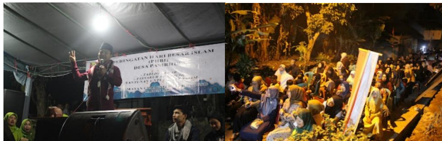
Gambar 15. Tabligh Akbar

Kegiatan ini menjadi acara puncak dari kegiatan perayaan hari besar Islam yaitu gema muharram 1445 H. Bertempat di desa pasirhuni, kec. Cimaung. Diisi oleh muballigh/da'i terkenal. Acara ini ikut dihadiri oleh perangkat desa setempat dan diramaikan oleh ibu-ibu, bapak-bapak, anak-anak, dan mahasiswa/i KKN kelompok 76, 77 dan 78 yang kebetulan menjadi panitia acaranya.