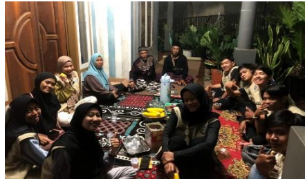
Gambar 1. Silaturahmi bersama pak Kadus 1 dan Pak Ketua RW 1