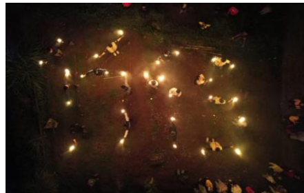
Gambar 14. Pawai Obor Keliling

Kegiatan ini diselenggarakan oleh pak ketua RW 01 dan atas sepengetahuan pak kepala dusun 01 desa Pasirhuni kampung Kadunenggang. Pawai obor dimulai ba'da sholat isya, titik kumpul bertempat di depan rumah pak kepala dusun 01. Kegiatan ini diramaikan oleh ibu bapak dan anak-anak desa Pasirhuni.