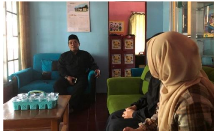
Gambar 2. Silaturahmi ke Rumah Pak Ketua MUI Desa Pairhuni

Hasil dari observasi yang telah kami laksanakan dan diskusikan dengan anggota kelompok, maka terbentuklah program kerja bidang keagamaan diantaranya adalah kegiatan keagamaan yang bersifat rutin maupun event besar. Dengan hadirnya dan keterlibatan kami di sini bertujuan untuk mengoptimalkan nilai-nilai keagamaan yang ada di sekitar lingkungan masyarakat dusun 1 desa Pasirhuni, terkhusus kegiatan yang sudah berdaya dari dahulu dan perlu dilestarikan guna menjaga nilai-nilai baik yang sudah tersebar di masyarakat sekitar.