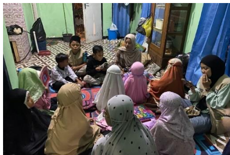
Gambar 8. Belajar Malam

Terlepas dari itu semua, kami berusaha memberikan contoh dan akhlak yang baik kepada orang yang lebih tua, sesama teman dan lingkungan. Kalau mereka melakukan hal yang tidak baik selama proses pembelajaran, maka kami akan menegur mereka dan menasehatinya.