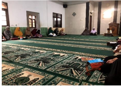
Gambar 9. Pengajian Rutinan

kaum kafir yang berusaha merusak generasi islam dengan cara merusak mental dan pola pikir mereka.