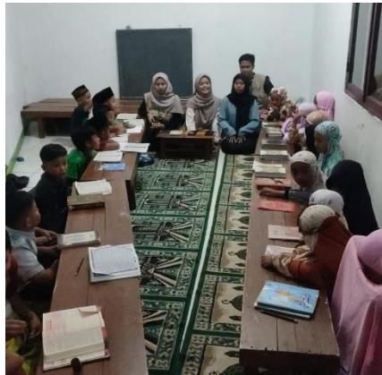
Gambar 7. Ngaji bersama anak-anak

membaca Al-quran. Karena Al-quran adalah kitab suci umat islam dan menjadi pedoman bagi kehidupan manusia.