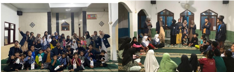
Gambar 13. Belajar dan Ngaji Bersama ba'da Maghrib di Masjid Al-Muhajirin