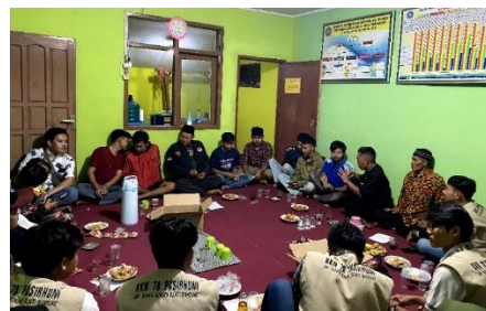
Gambar 3. Musyawarah Desa (Rembuk Warga)

Setelah melakukan observasi lapangan dan mendapatkan data valid dari pihak setempat, selanjutnya kami mengumpulkan ide dan gagasan kita terkait program apa saja yang akan diusung dalam kegiatan pengabdian KKN 40 hari kedepan. Hal tersebut akan diungkapkan pada saat sosialisasi awal atau yang biasa kita sebut dengan rembuk warga (mengumpulkan para petinggi dan pejabat desa setempat untuk mensosialisasikan program kerja KKN Sisdams Moderasi Beragama Kelompok 78 Desa Pasirhuni, Kecamatan Cimaung, Kab. Bandung).