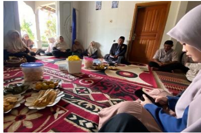
Gambar 12. Pengajian 4 Bulanan

bulan untuk dido'akan bersama-sama agar kelak janin yang dikandungnya menjadi anak yang shoih/sholihah dan berguna bagi nusa bangsa kelak.