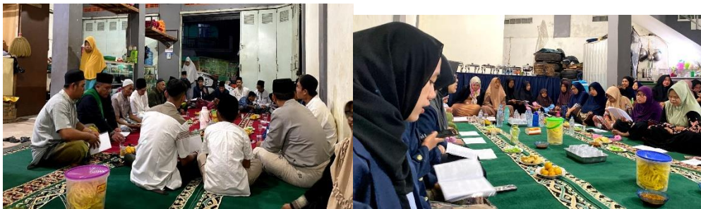
Gambar 10. Pengajian Rutinan

Kegiatan berlangsung sesuai dengan jadwal pengajian yang sudah ditentukan sebelumnya oleh ibu pengajian, tinggal kami selaku mahasiswa ikut meramaikan dan kebersamai dalam kegiatan pengajian rutin. Alhamdulillah kegiatan keagamaan di dusun 1 desa Pasirhuni ini masih sangat kental dan terjaga kesolidannya untuk terus mensyiarkan agama islam.