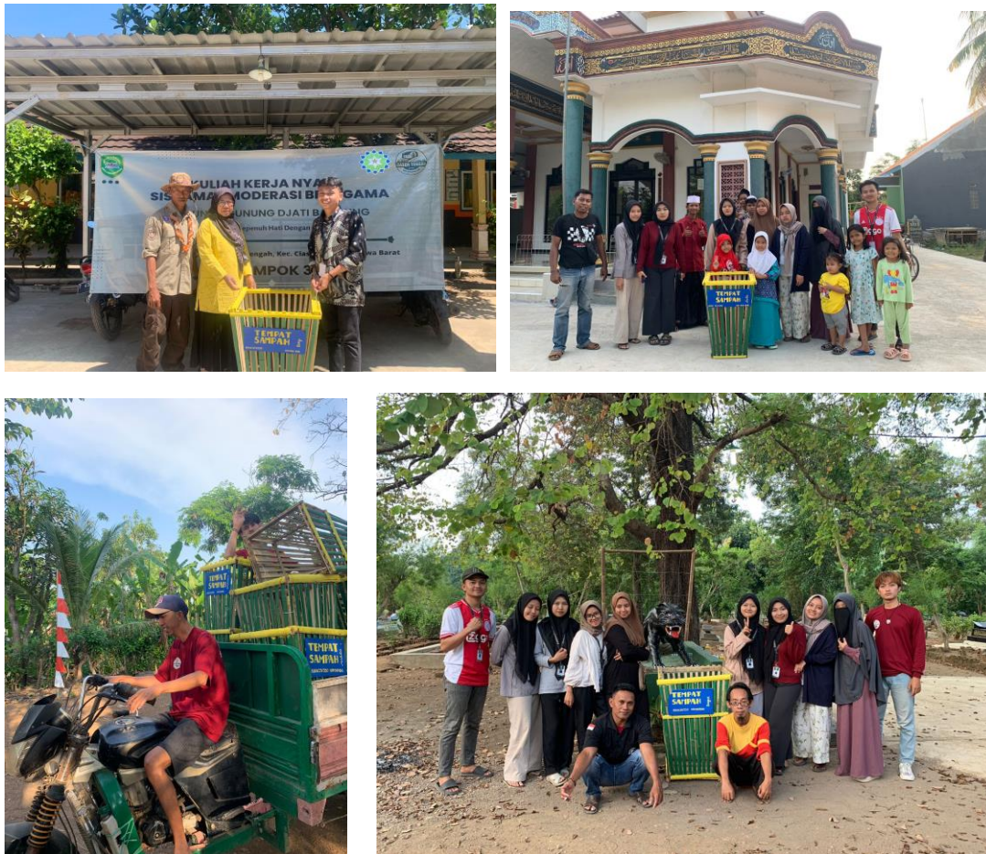
Gambar 4. Penempatan tempat sampah di beberapa titik tertentu