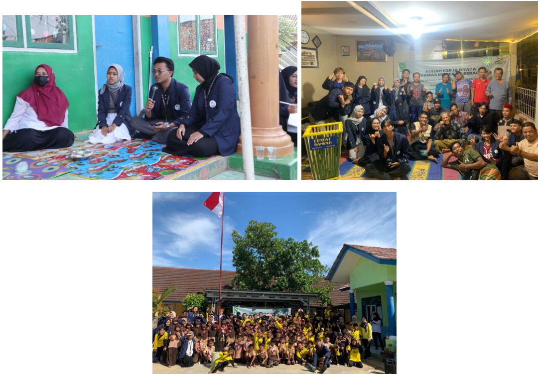
Gambar 2.2 Hasil Penyuluhan di Dusun Marjim Dan SDN Moch.Toha