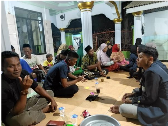
Gambar 1. Sosialisasi awal dengan warga Dusun Marjim