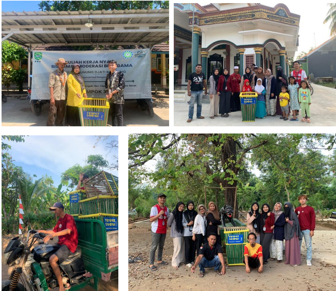
Gambar 4. Penempatan tempat sampah di beberapa titik tertentu