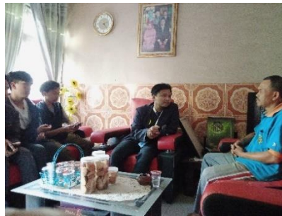
Gambar 1. Rapat dan koordinasi ke RW 10

Dari hasil rapat dan koordinasi dari ketua – ketua RW kegiatan sosialisasi seminar digital marketing dengan menjemput bola, jadi kelompok kita melakukan seminar di setiap RW. Dari RW 10 dilakukan pada hari Sabtu, 12 Agustus 2023 bertempat di rumah Pak RW. Dan untuk RW 12 dilakukan pada hari Minggu, 13 Agustus 2023 bertempat di rumah Ibu Kader. Sedangkan untuk RW 18 pelaku UMKM nya sedikit jadi disatukan dengan RW 12