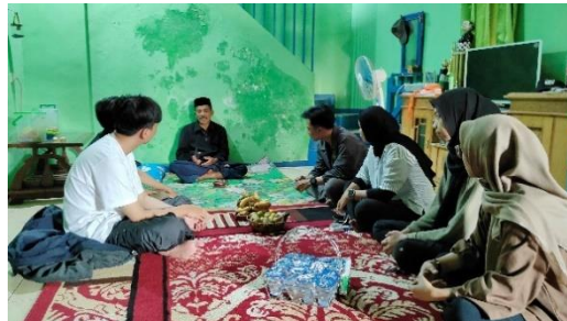
Gambar 2. Rapat dan koordinasi ke RW 12

Dari hasil rapat dan koordinasi dari ketua – ketua RW kegiatan sosialisasi seminar digital marketing dengan menjemput bola, jadi kelompok kita melakukan seminar di setiap RW. Dari RW 10 dilakukan pada hari Sabtu, 12 Agustus 2023 bertempat di rumah Pak RW. Dan untuk RW 12 dilakukan pada hari Minggu, 13 Agustus 2023 bertempat di rumah Ibu Kader. Sedangkan untuk RW 18 pelaku UMKM nya sedikit jadi disatukan dengan RW 12