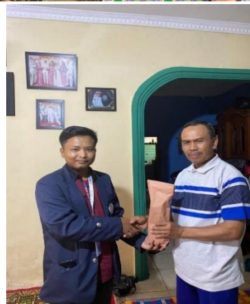
Gambar 6. Sesi foto Bersama dan pemberian hadiah