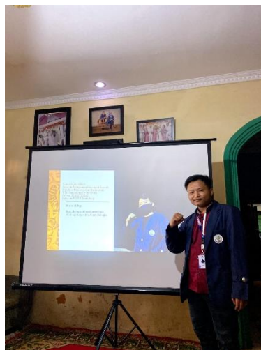
Gambar 4. Penyampaian materi manajemen keuangan syari'ah