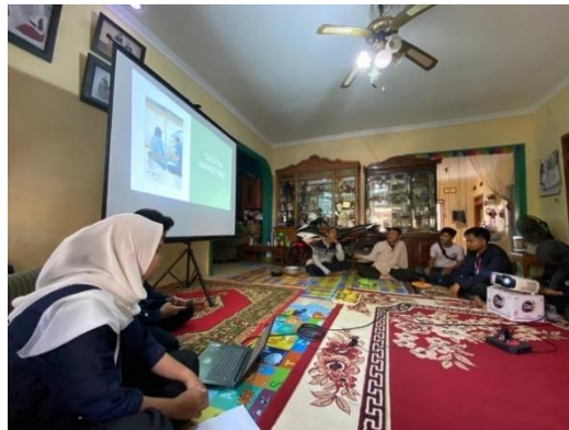
Gambar 5. Sharing Session

Pada sesi sharing session ada pelaku UMKM yang mengalami permasalahannya yaitu dia melakukan usahanya sendiri dari modal, produksi, pemasaran, dan mengatur keuangan. Karena keterbatasan modal dia tidak sanggup membayar karyawan, tidak paham soal digital marketing, dan takut memakai digital marketing jumlah penjualannya meningkat dan dia tidak sanggup memenuhi pesannya.