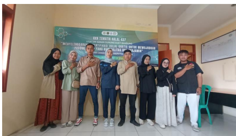
Gambar 1.1 Foto bersama tim PPS Desa Bandasari setelah diskusi konten Pemilu

dalam mengelola media sosial. Kami berkenalan terlebih dahulu dengan para panitia secara struktural, dimulai dari Ketua Panitia hingga divisi yang ada. Beberapa media sosial yang dikelola oleh tim PPS diantaranya, Instagram, Twitter, Facebook, dan Tiktok. Berdasarkan hasil wawancara yang telah dilakukan, terdapat beberapa konten yang harus dibuat oleh admin media sosial seperti, konten berita, postingan video, infografis, timeline kegiatan, podcast, puzzle, serta peringatan hari-hari besar di Indonesia.