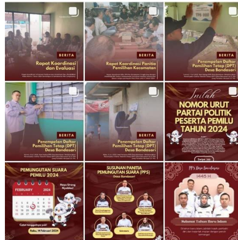
Gambar 1.7 Hasil dari Monitoring dan Evaluasi Postingan yang dibuat Tim PPS Desa Bandasari